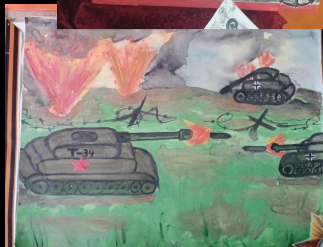
Ренат Лушков правнук