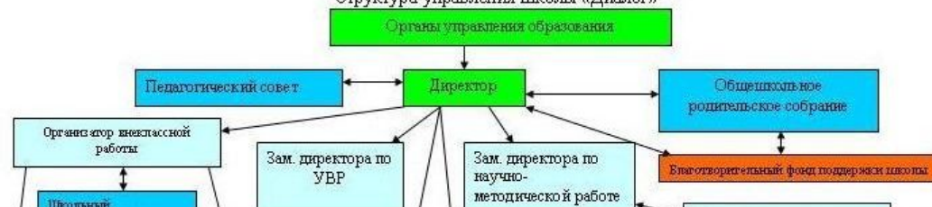
Структура управления школы «Диалог»