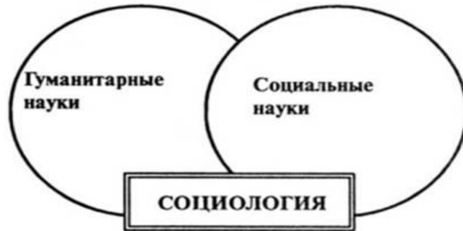
Рис. 1.2. Социология обладает двойным статусом: она принадлежит к социальным и гуманитарным наукам