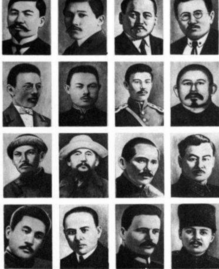
Руководители национально-освободительного и революционного движения в Казахстане