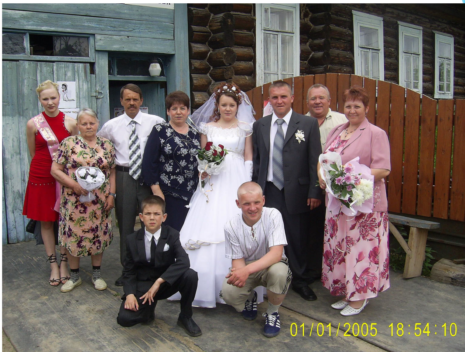
Семейные фотографии семьи Сторожевых и Шишковых: