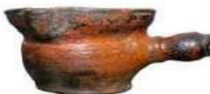
ГОРШОК ДЛЯ ТОПЛЕНИЯ МАСЛА