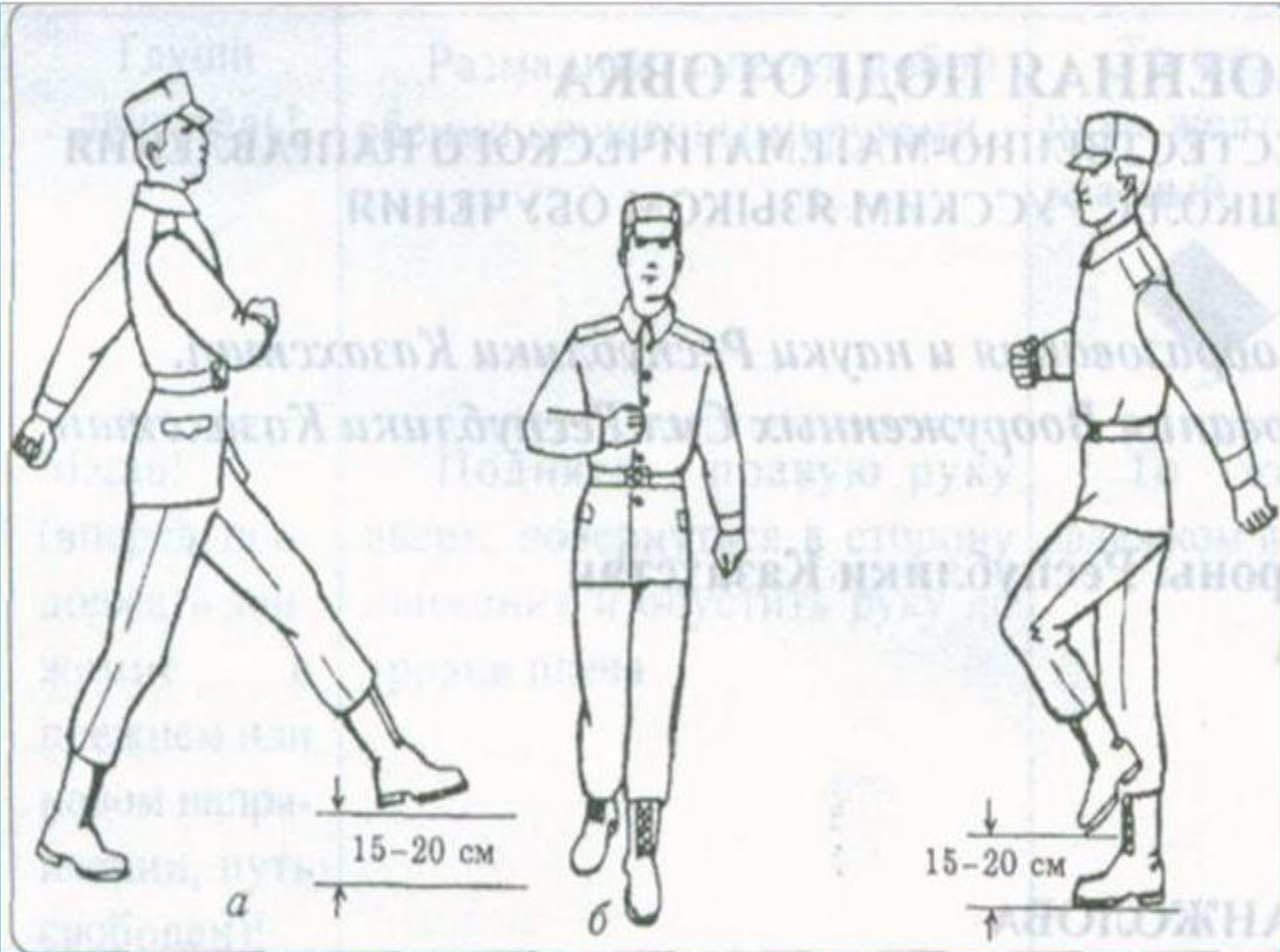
Рис. 122. Движение строевым шагом.