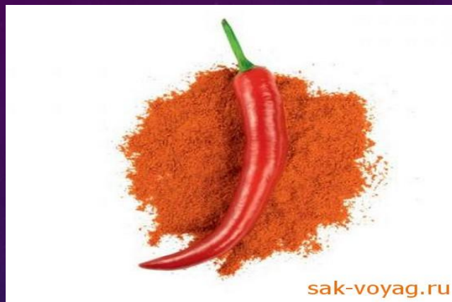
1 chili pepper