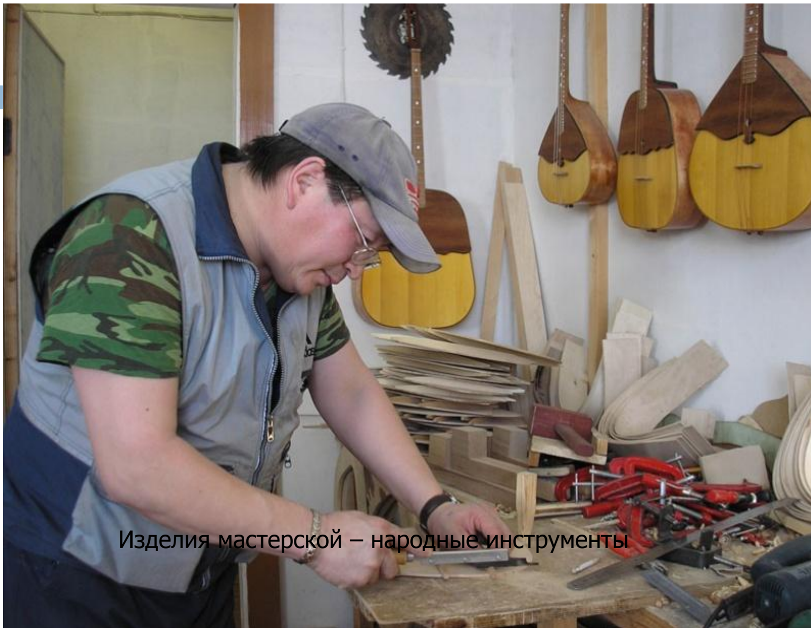
Изделия мастерской – народные инструменты