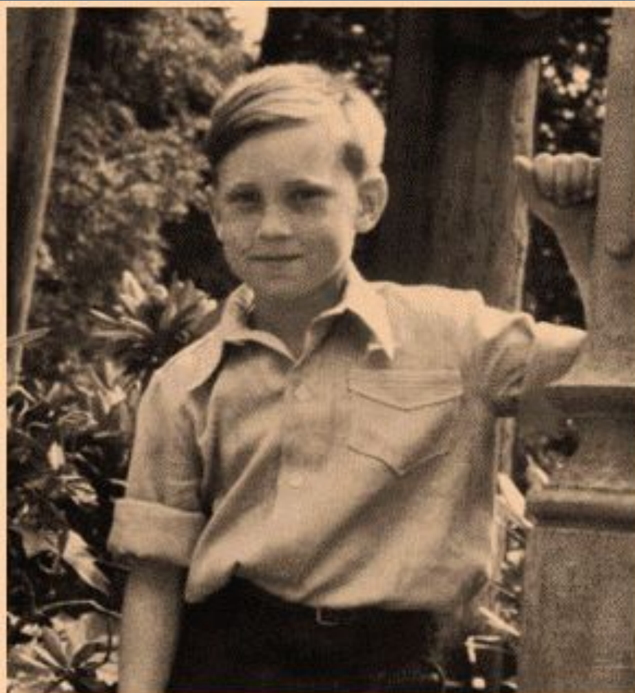
г.Бад Эльстер, Германия, 1948 г.