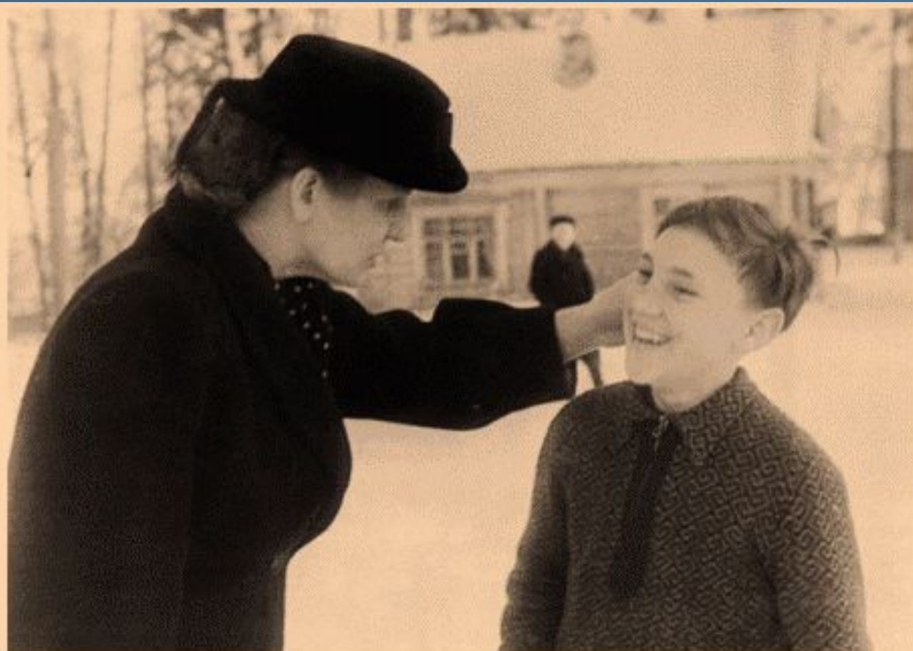
В зимнем пионерском лагере "Машиностроитель", г.Покров Владимирской области, январь 1950 г.