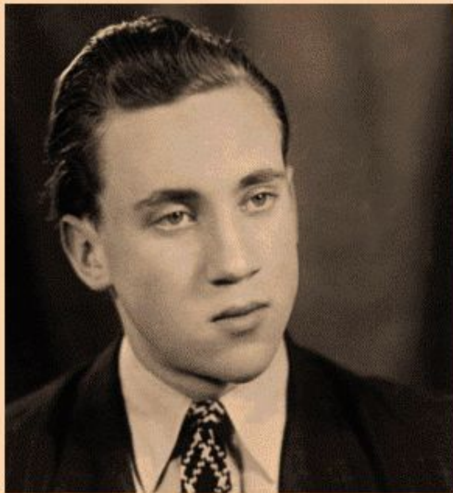
Студент МИСИ им. В.Куйбышева, 1955 г.