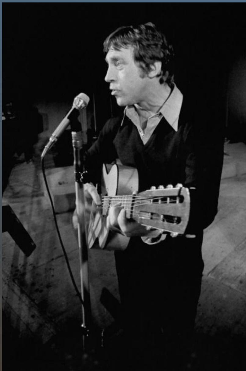
ВЛАДИМИР СЕМЁНОВИЧ ВЫСОЦКИЙ