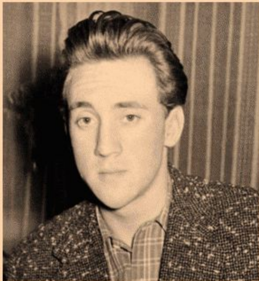
В конце 10-го класса, Москва, 1955 г.