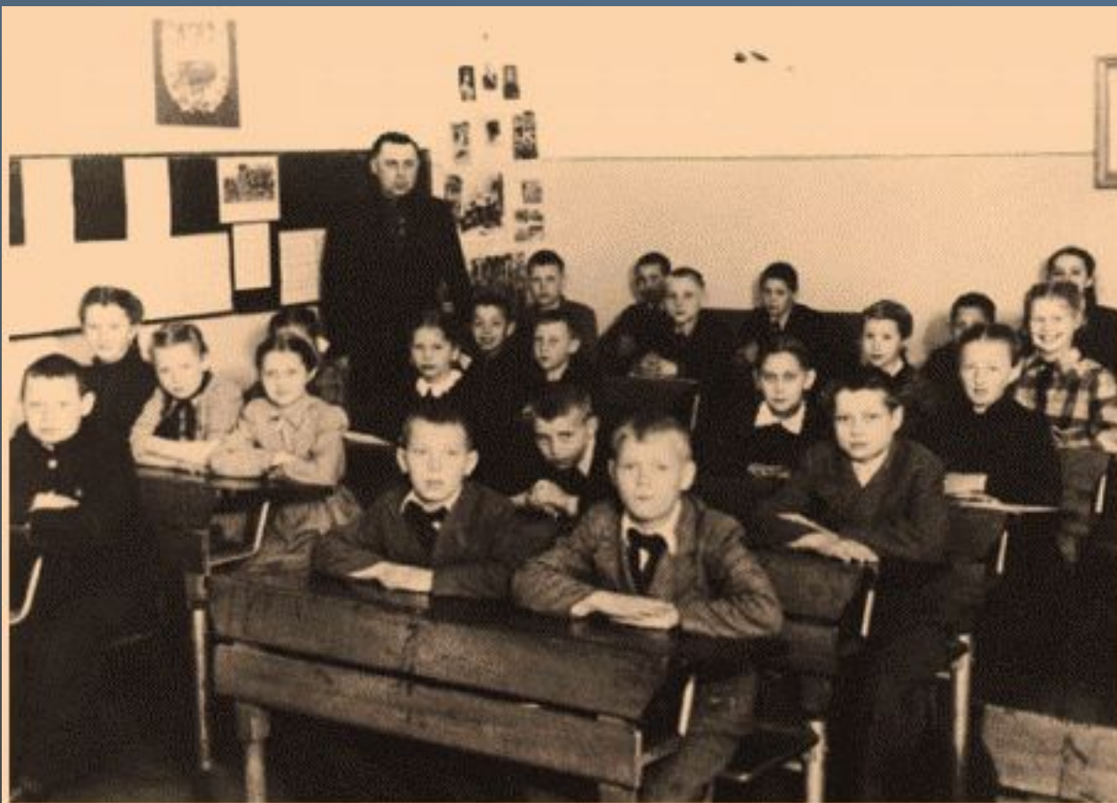
3-й класс, г.Эберсвальде, Германия, 1948 г.