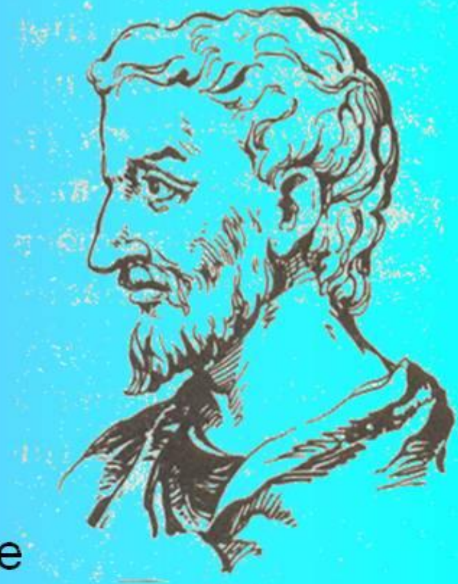
Пифагор – древнегреческий ученый (VI в. до н. э.)

Знаменитый греческий философ и математик Пифагор Самосский, именем которого названа теорема, жил около 2,5 тысяч лет тому назад. Дошедшие до нас биографические сведения о Пифагоре отрывочны и далеко недостоверны. С его именем связано много легенд.