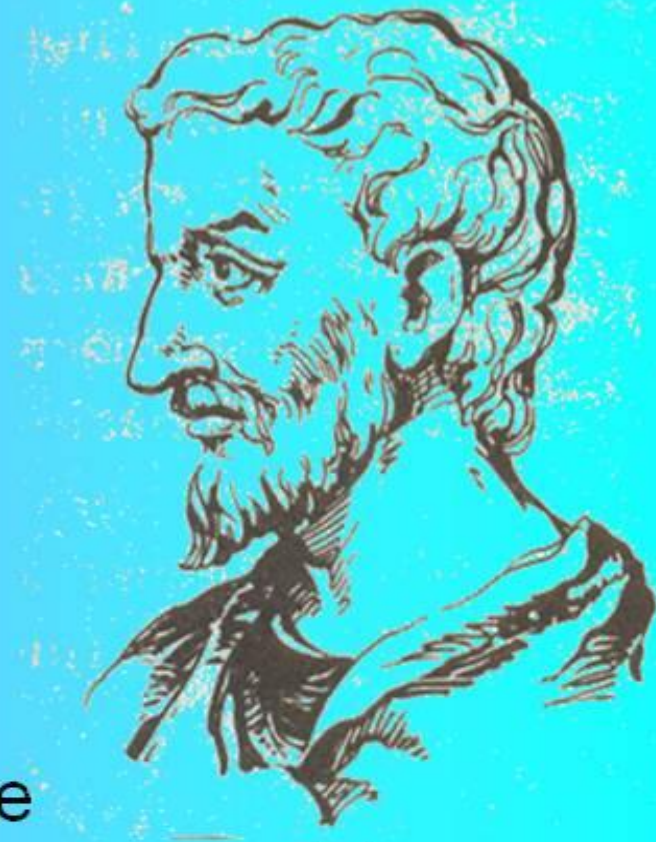
Пифагор – древнегреческий ученый (VI в. до н. э.)

Знаменитый греческий философ и математик Пифагор Самосский, именем которого названа теорема, жил около 2,5 тысяч лет тому назад. Дошедшие до нас биографические сведения о Пифагоре отрывочны и далеко недостоверны. С его именем связано много легенд.