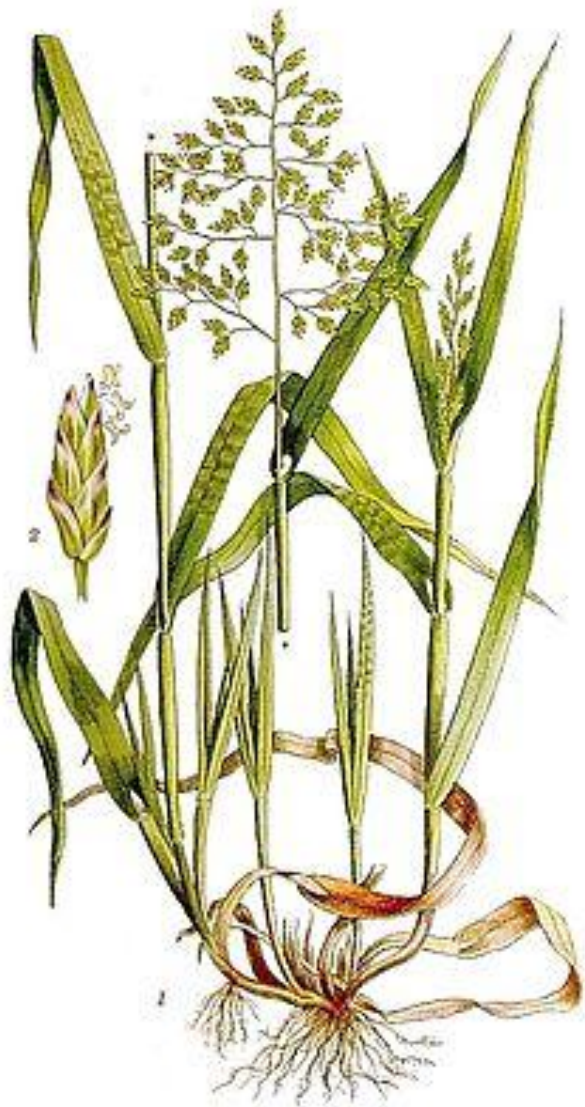
VITGRÖE, POA ANNUA L.