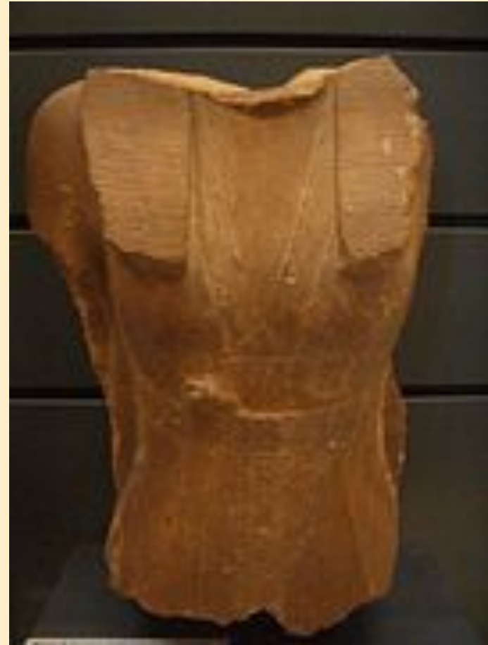
Торс статуи царицы Нефрусобек (музей Лувра)