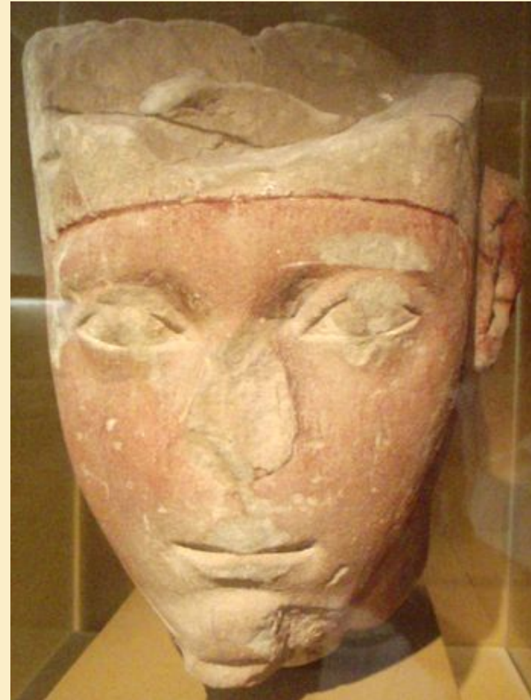
Голова статуи Аменхотепа I. Музей изящных искусств, Бостон.