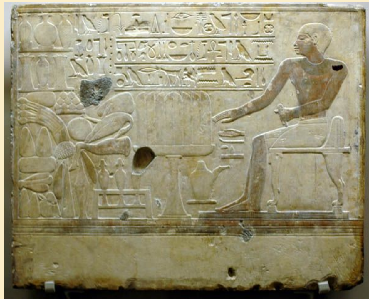
Стела с изображением Аменемхет I. Крашеный известняк. Находится в Британском музее, Лондон, Великобритания.

Узурпатор трона и основатель одной из самых сильных египетских династий – XII (1985-1773 гг. до н.э.)