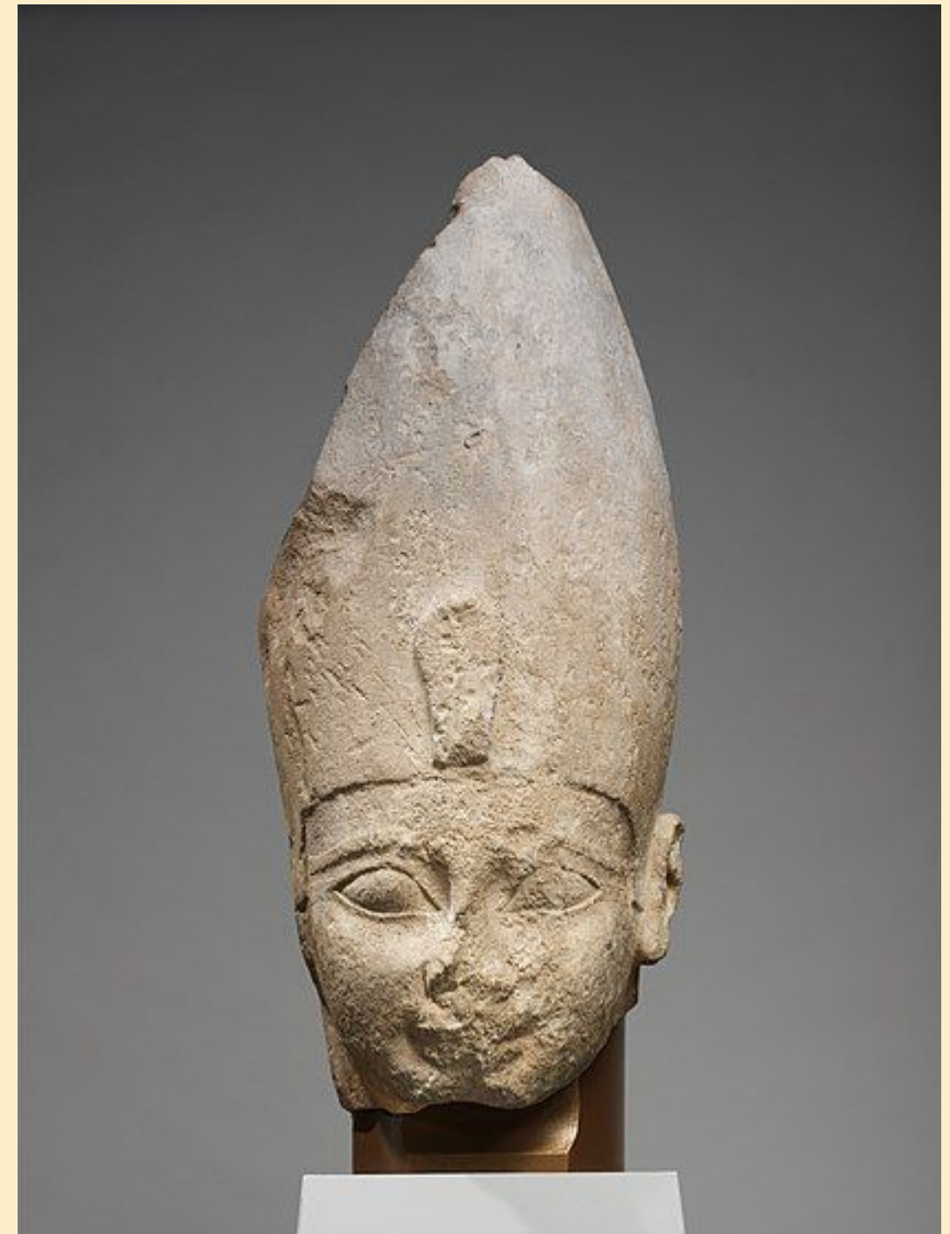
Фрагмент статуи Яхмоса I. Музей Метрополитен