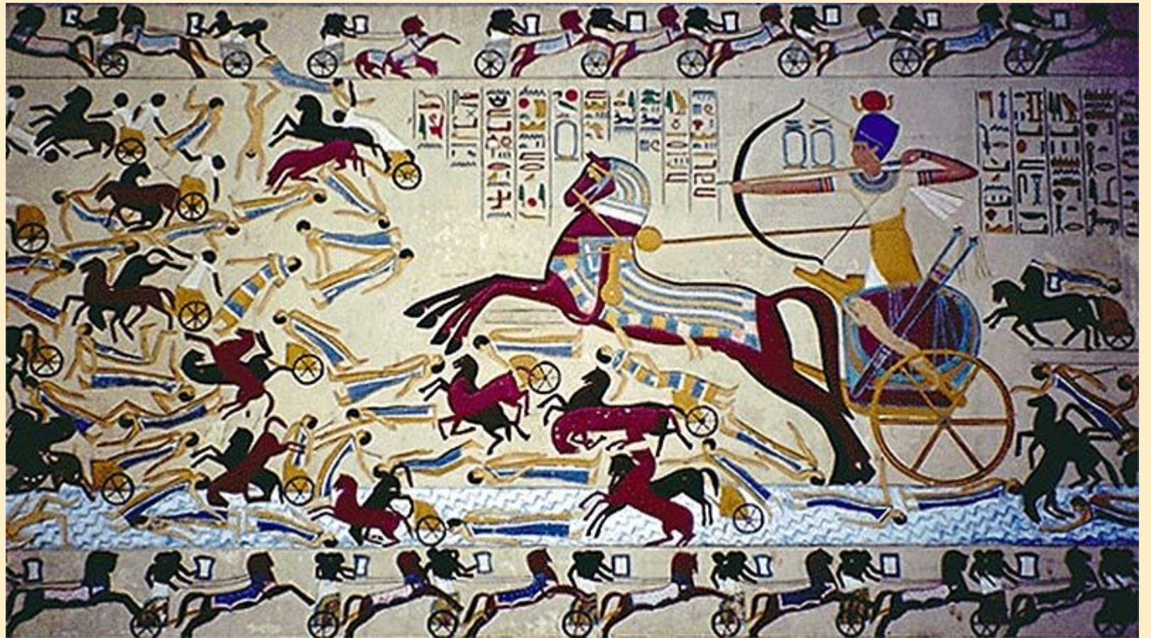
Роспись в гробнице. Яхмос I побеждает гиксосов.

Яхмос I (мл. брат Камоса) штурмовал Аварис, захватил крепости Шарухен в Южной Палестине и основал XVIII династию.