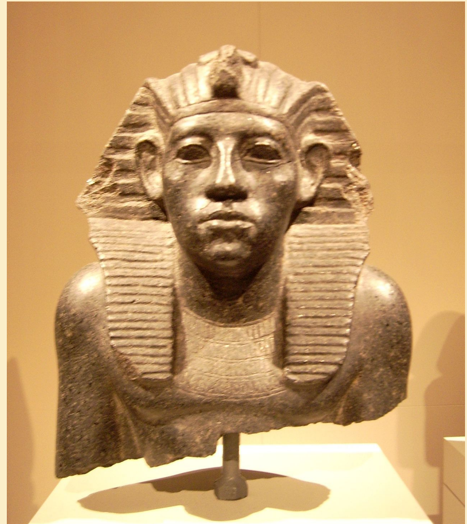
Голова статуи, гранит, Египетский музей Берлина