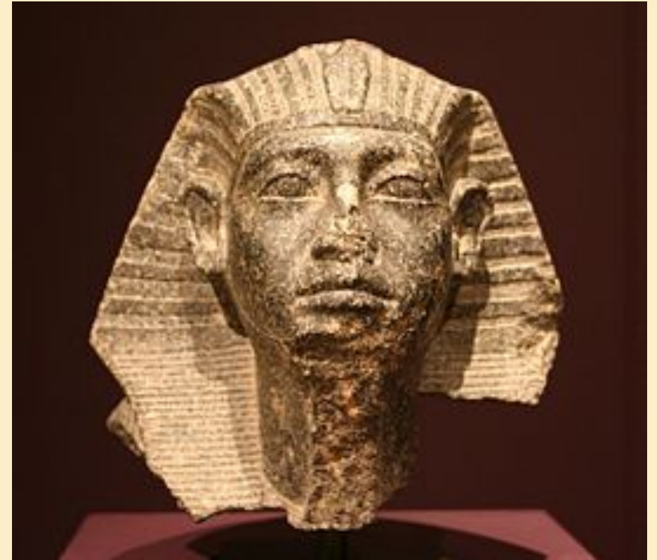
Сфинкс с его лицом, Государственный музей египетского искусства в Мюнхене