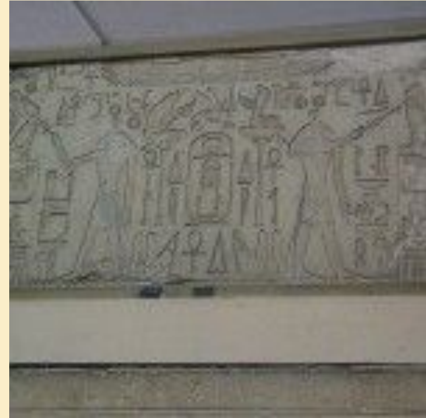
Стела Тутмоса I в Каирском музее.