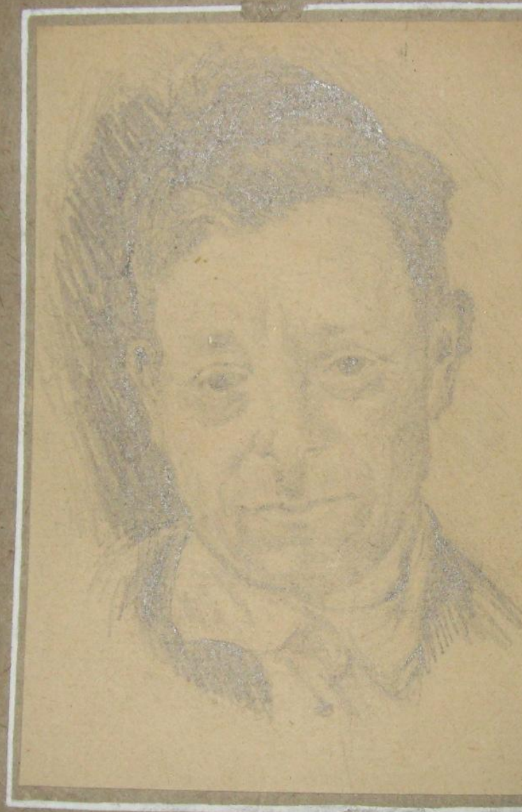
Никулин А.Г. Набросок головы.