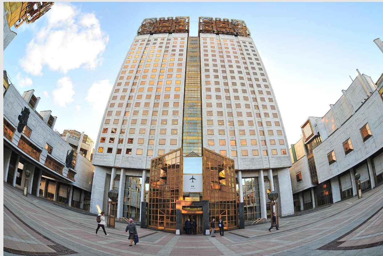
Здание Российской академии наук в Москве