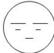
БЕЗРАЗЛИЧИЕ (мне все равно)