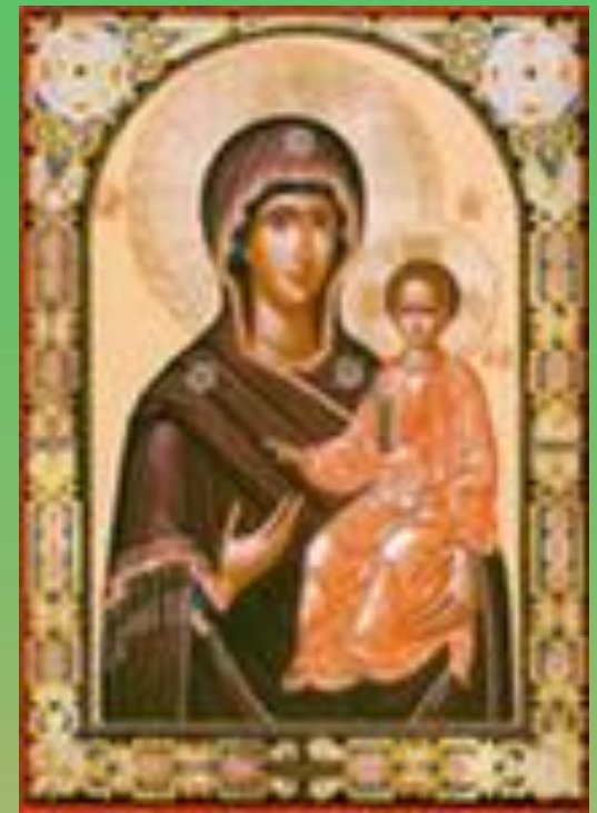
Смоленская икона Божией Матери