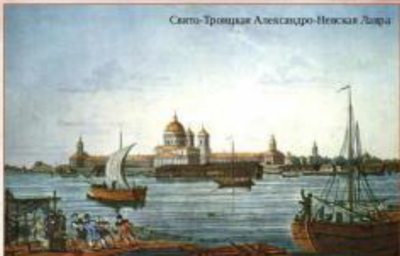
Свято-Троицкая Александро-Невская Лавра

В том месте, где по преданию была Невская битва, поставили Александрo-Невскую лавру.