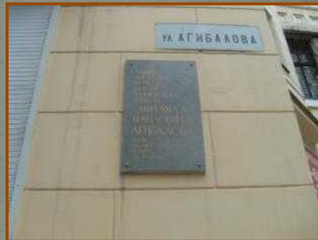
Улица М.П. Агибалова