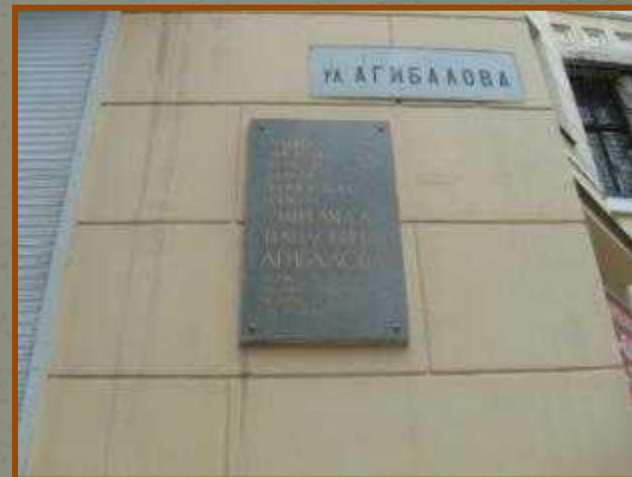
Улица М.П. Агибалова