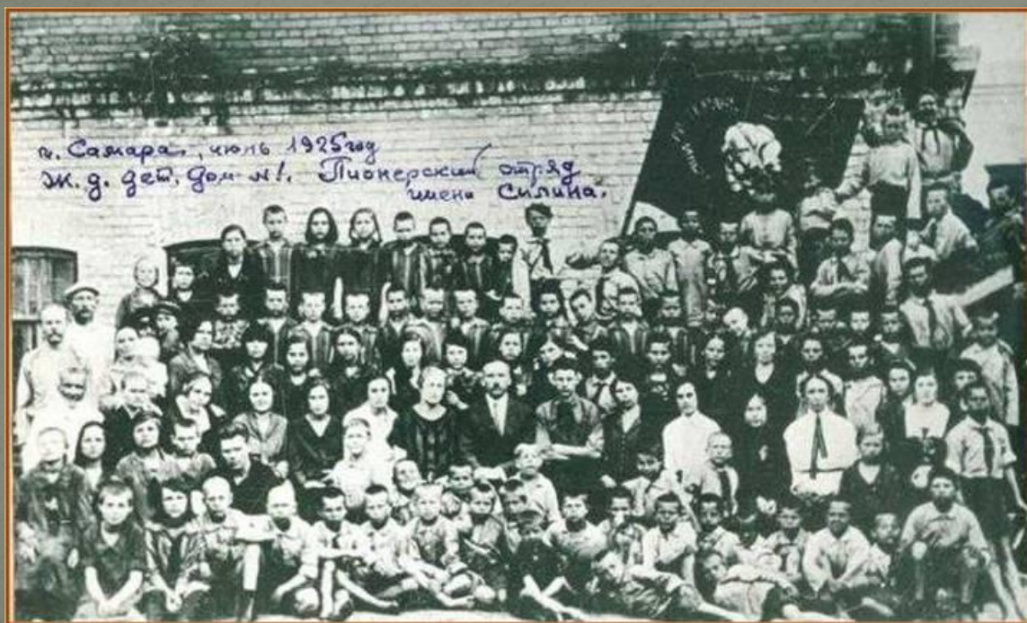
Железнодорожный детский дом №1. 1925 г.