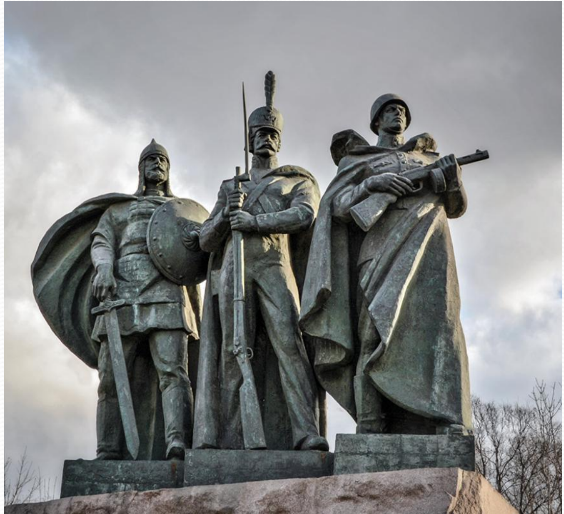
ЗАЩИТНИКАМ ЗЕМЛИ РОССИЙСКОЙ на Поклонной горе, Москва

Россия всегда славилась своими отважными сыновьями и дочерьми. Таким количеством славных, по-настоящему героических имен не может похвалиться ни одно государство мира. Истоки этих подвигов, совершенных в разные исторические эпохи обладали единым чувством – искренней и глубокой, бескорыстной и самоотверженной любовью к Отечеству.