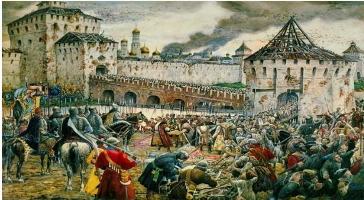
Эрнест Листнер. Изгнание польских интервентов из Московского Кремля.

Вспомним ополчение новгородцев. Огромное количество вооруженных людей, выдвинувшаяся из Нижнего Новгорода на помощь Москве. Она состояла не только из русских воинов, но еще из башкир, татар, калмыков и конных отрядов народов Кавказа. Преодолев более двух сотен верст, они разгромили войско польских шляхтичей и освободили свою златоглавую столицу от врага.