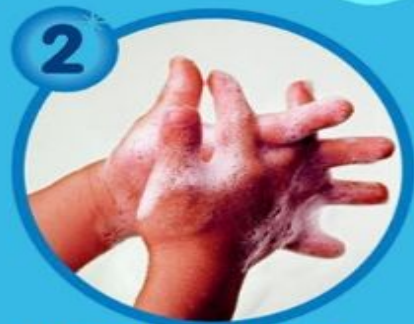
Ладонка об ладонку