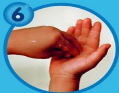
Моем пальчики с внешней стороны