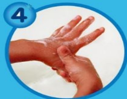
Тыльные стороны ладоней