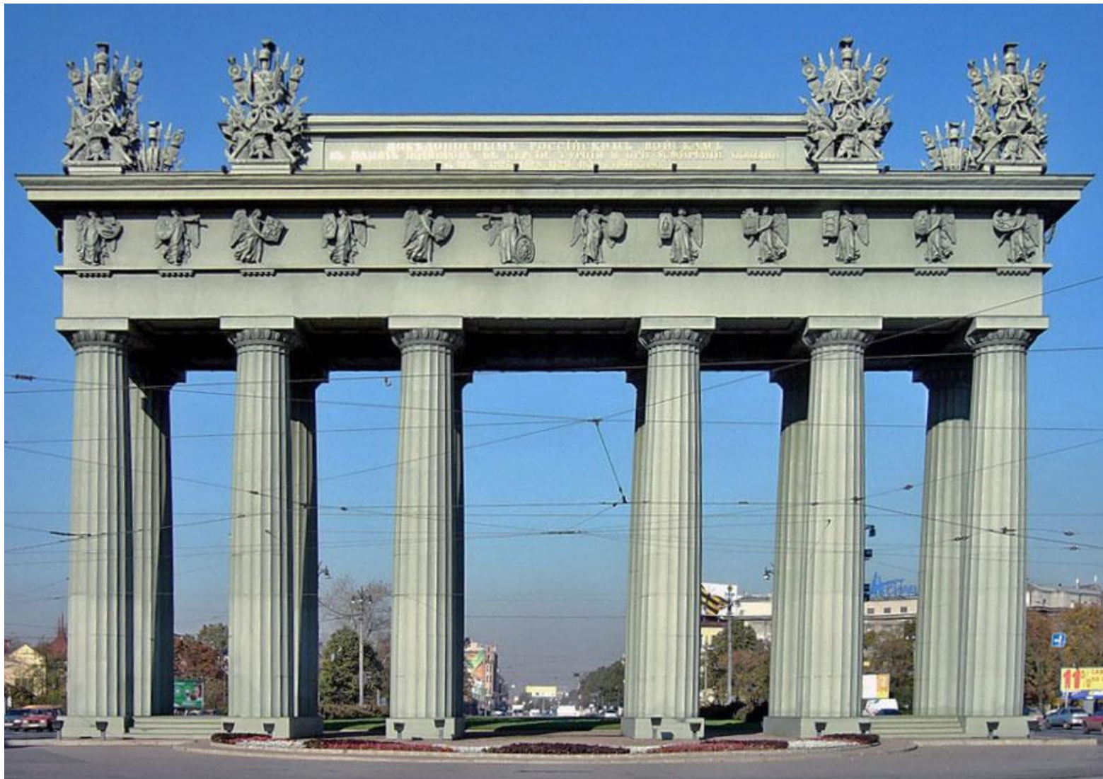
9. В.Стасов. Московские триумфальные ворота. Санкт-Петербург. 1834–1838. Ампир (поздний (русский) классицизм).