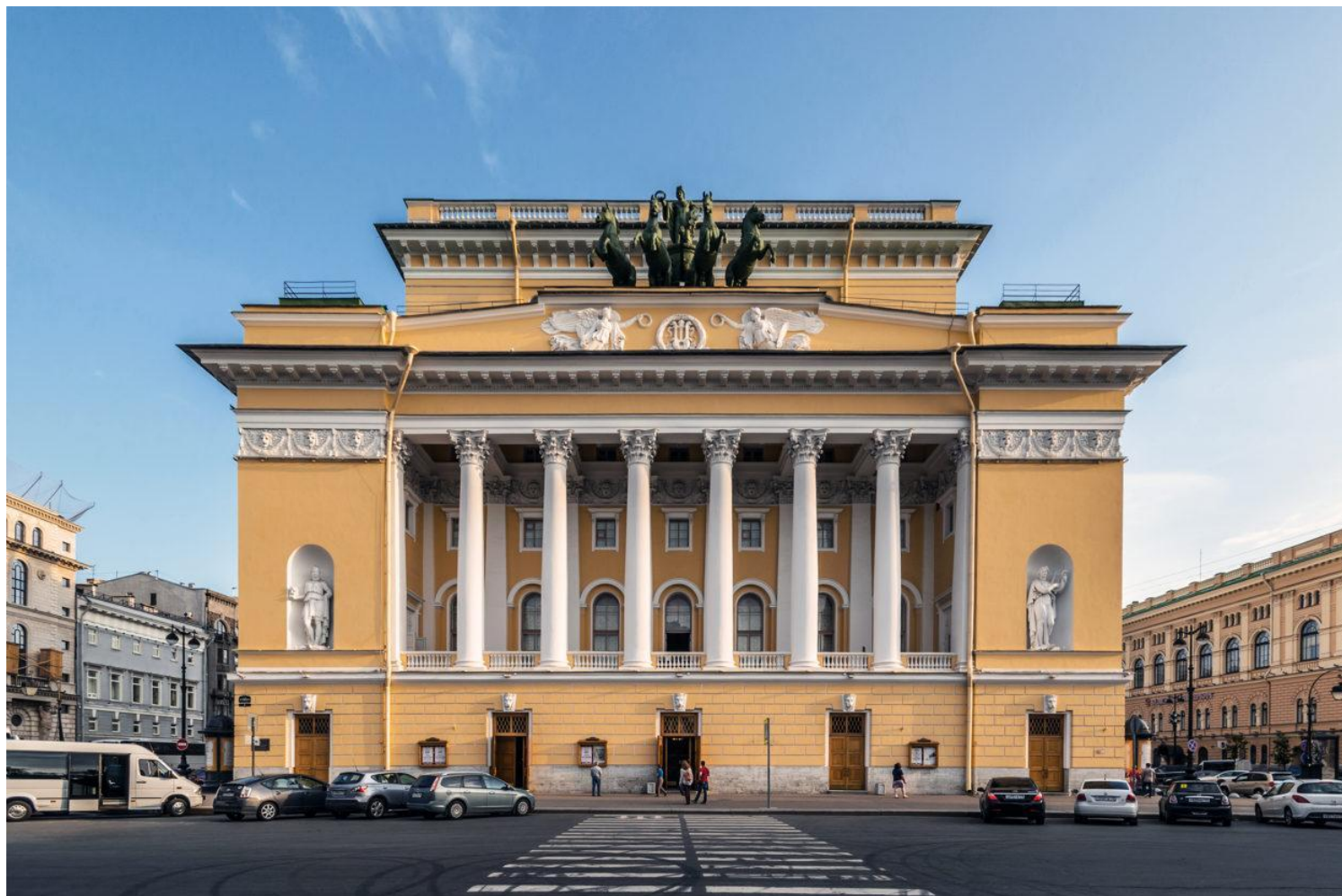
6. К.Росси. Александринский театр. Санкт-Петербург. 1816–1834. Ампир (поздний (русский) классицизм).