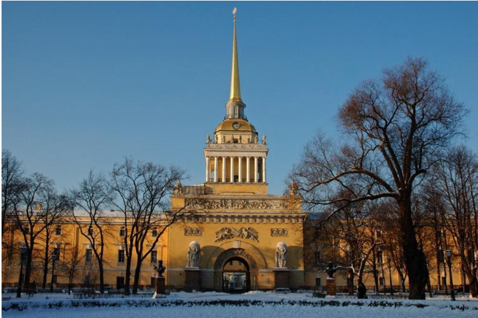
1. А.Захаров. Адмиралтейство. Санкт-Петербург. 1806–1823. Ампир (поздний (русский) классицизм).