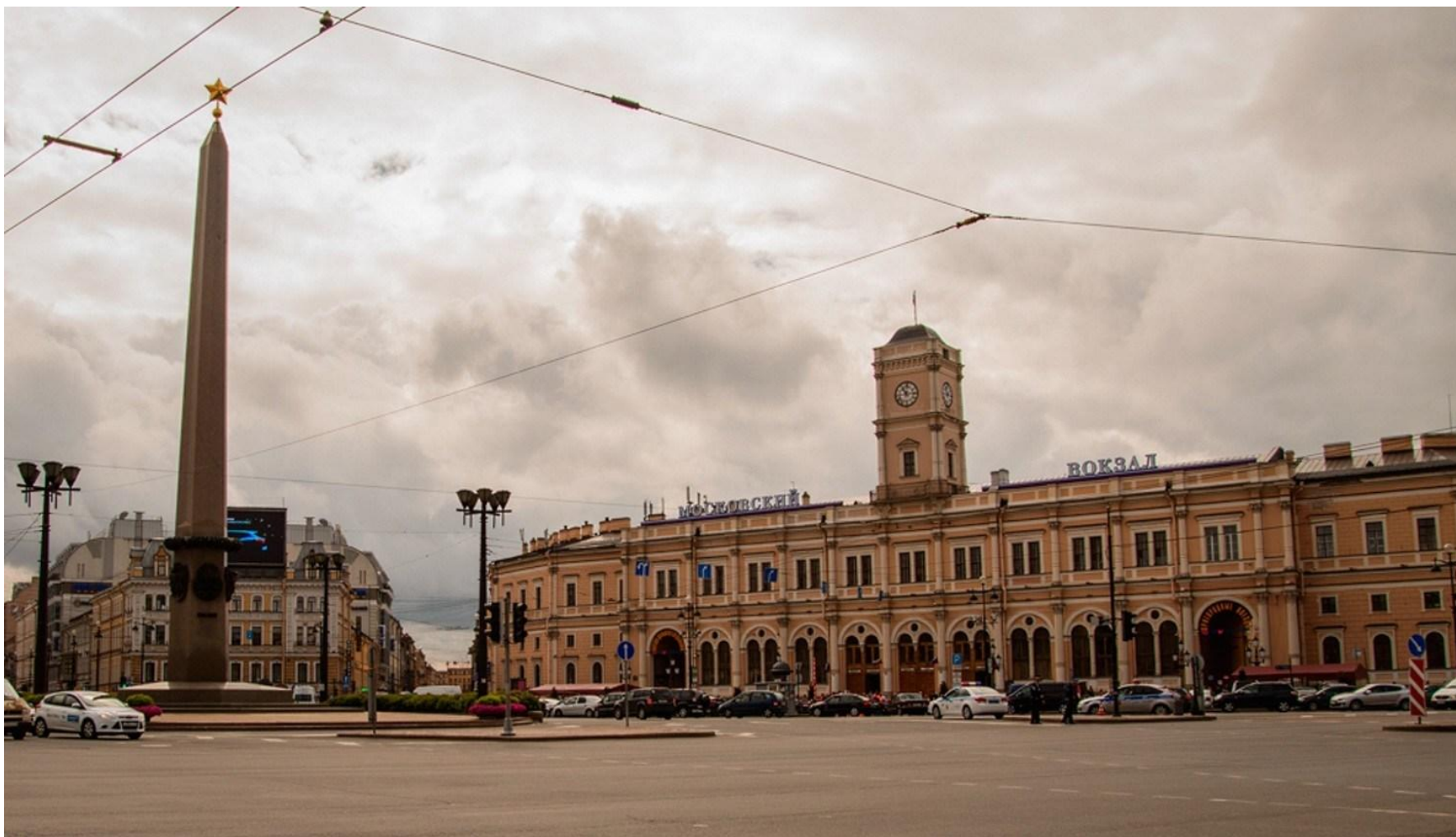
14. К.И.Тон. Московский (Николаевский) вокзал. 1844-1851. Эkleктика.