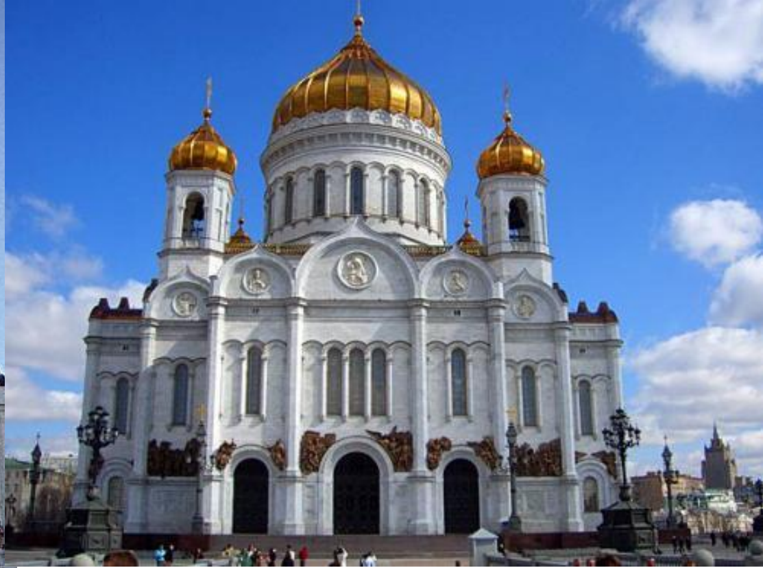
13. К.Тон. Храм Христа Спасителя. Москва. 1837–1889. Русский (русско- византийский стиль) — разновидность эkleктики .