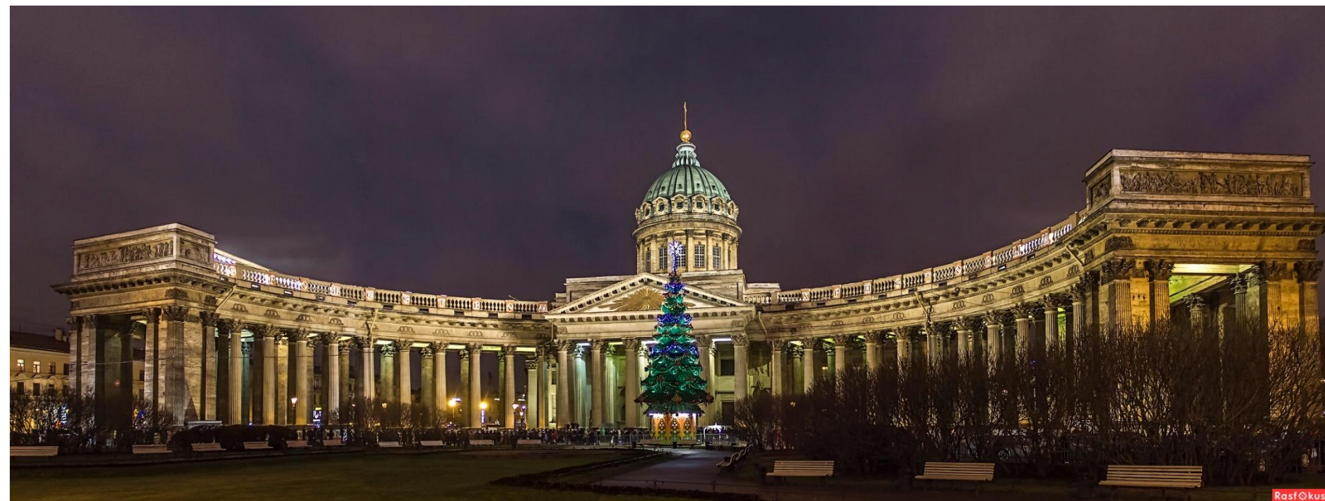
3. А.Воронихин. Казанский собор. Санкт-Петербург. 1801–1811. Ампир (поздний (русский) классицизм).