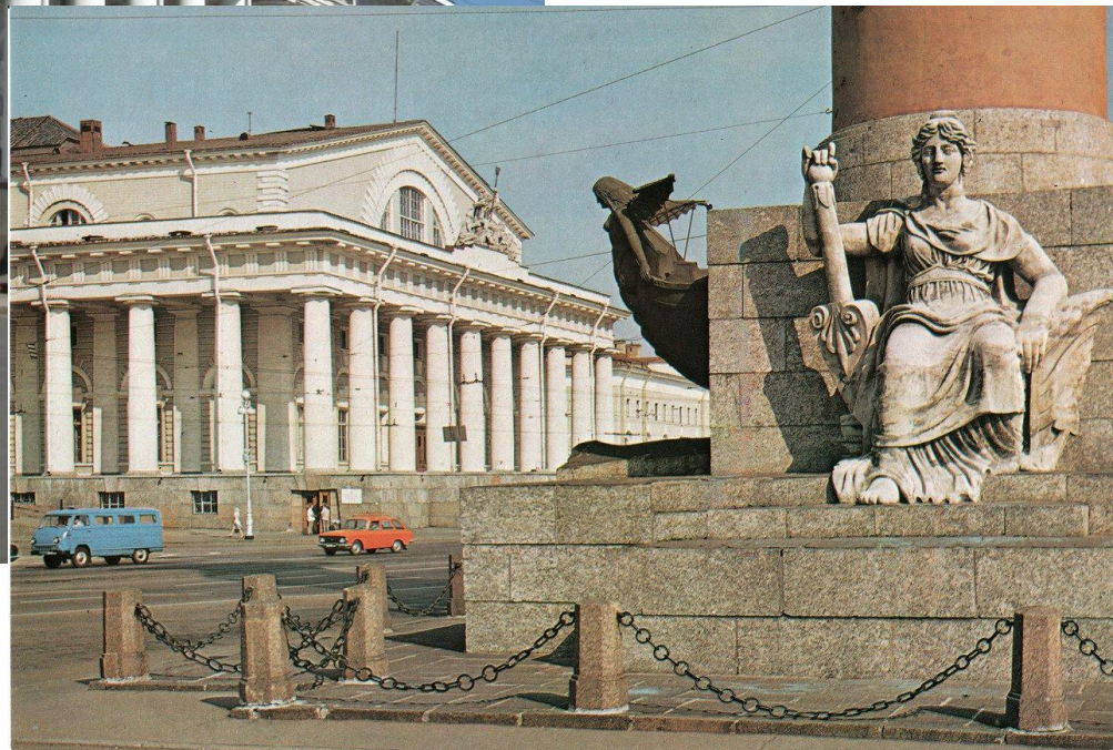
2. Ж.Ф. Тома де Томон. Здание Биржи. Санкт-Петербург. 1805–1810. Александровский классицизм (суть этого явления обозначена выше применительно к творчеству Дж. Кваренги)