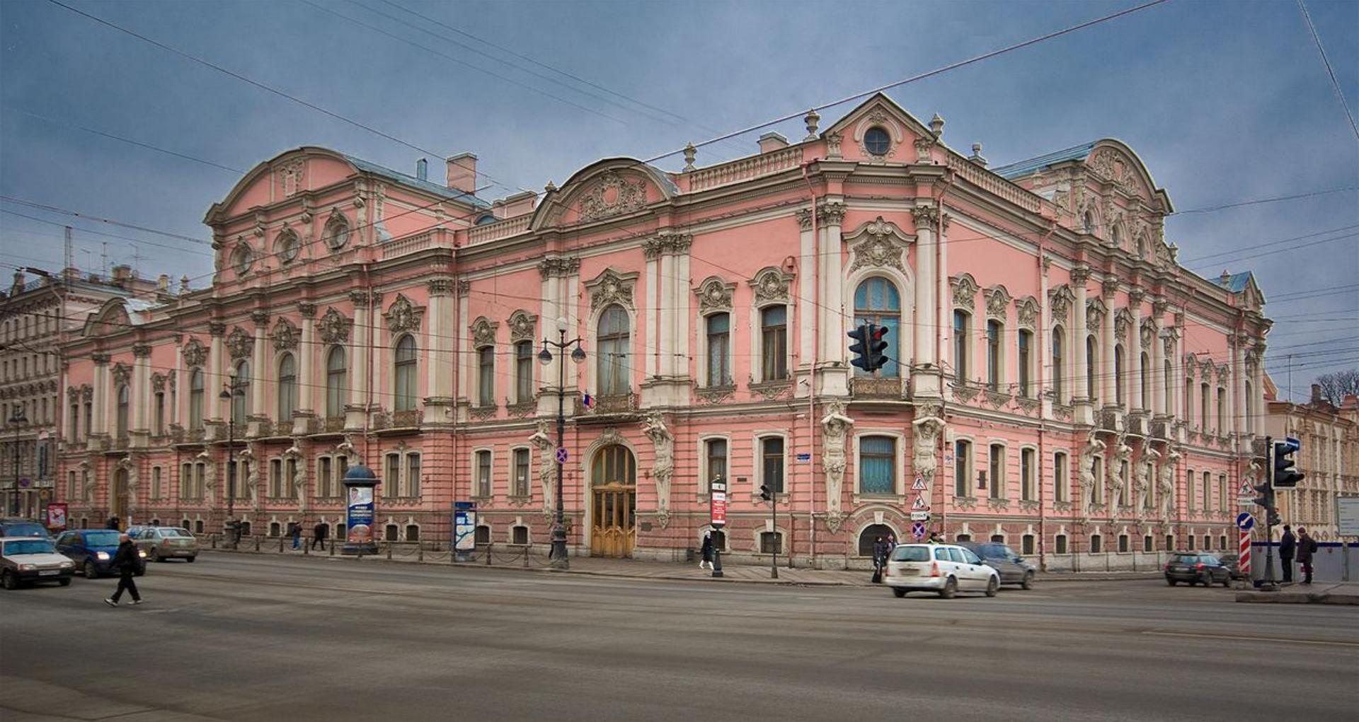
15. А.И.Штакеншнейдер. Дворец Белосельских-Белозерских . 1851. Необарокко (исторические стили как проявление эклектического мышления).