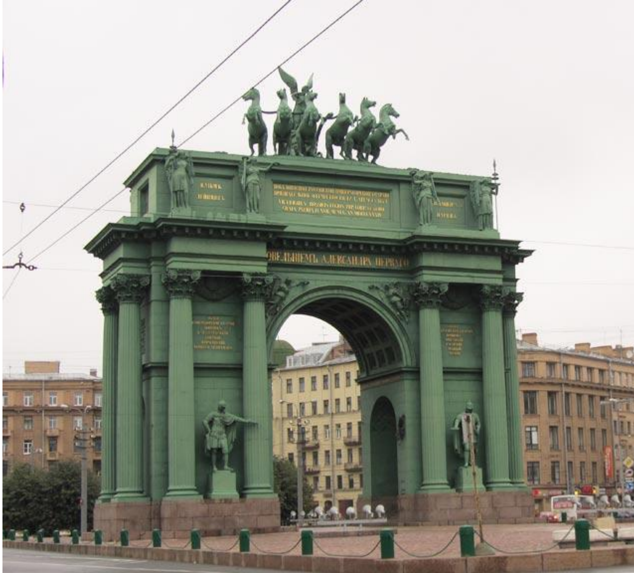
10. В.Стасов. Нарвские триумфальные ворота. Санкт-Петербург. Ампир (поздний (русский) классицизм).