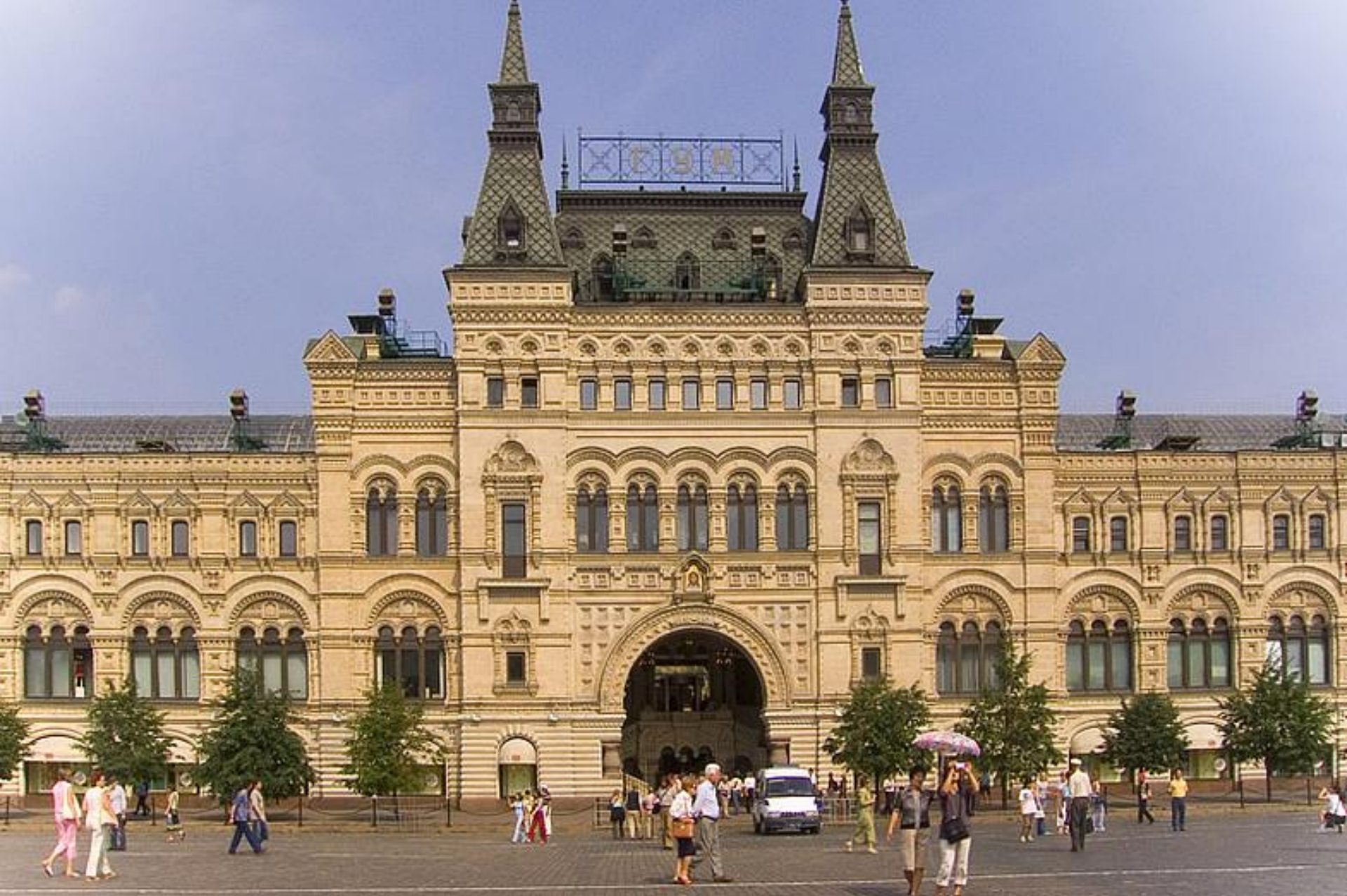
16. Н.А.Померанцев. Верхние торговые ряды ГУМ в Москве. 1889–1893. Эклектика.