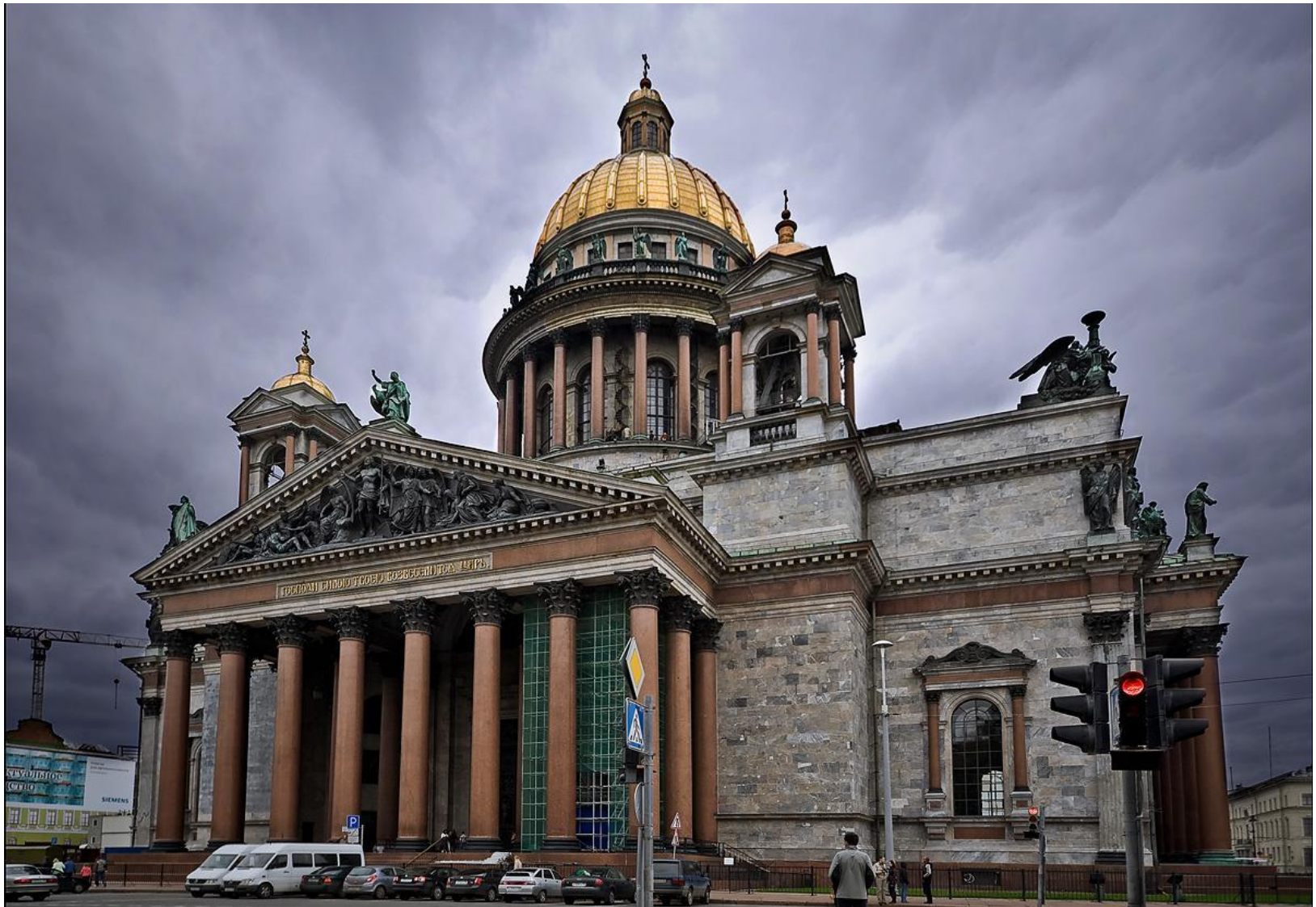
12. О.Монферран. Исаакиевский собор. Санкт-Петербург. 1818–1858. Эклектика.