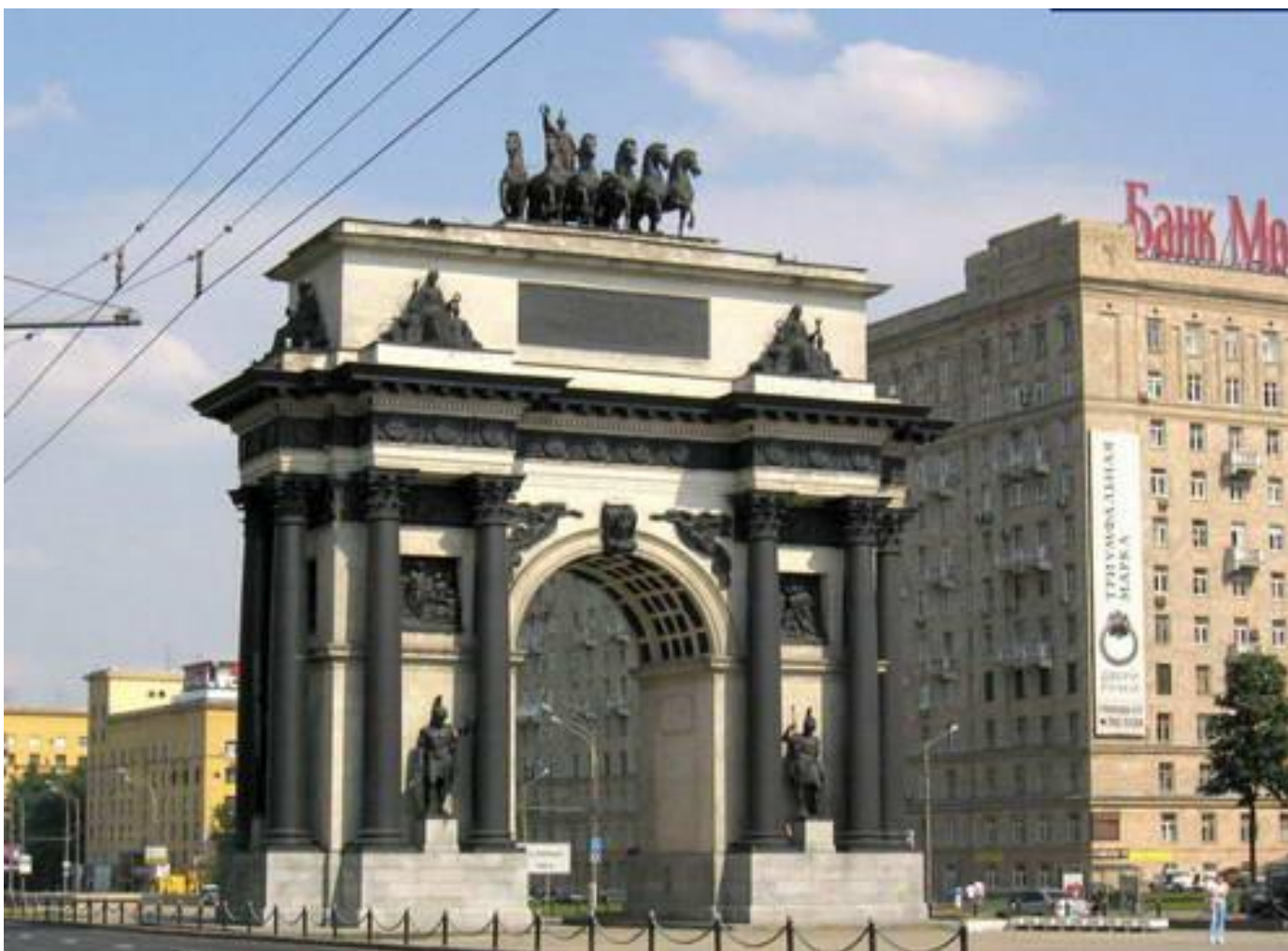
8. О.Бове. Триумфальные ворота. Москва. 1827–1834 гг. Ампир (поздний (русский) классицизм).