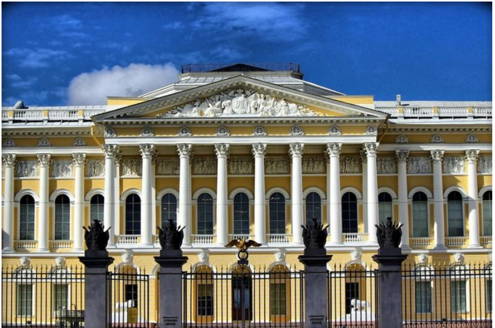
4. К.Росси. Михайловский дворец (Русский музей). Санкт-Петербург. 1819–1825. Ампир (поздний (русский) классицизм).