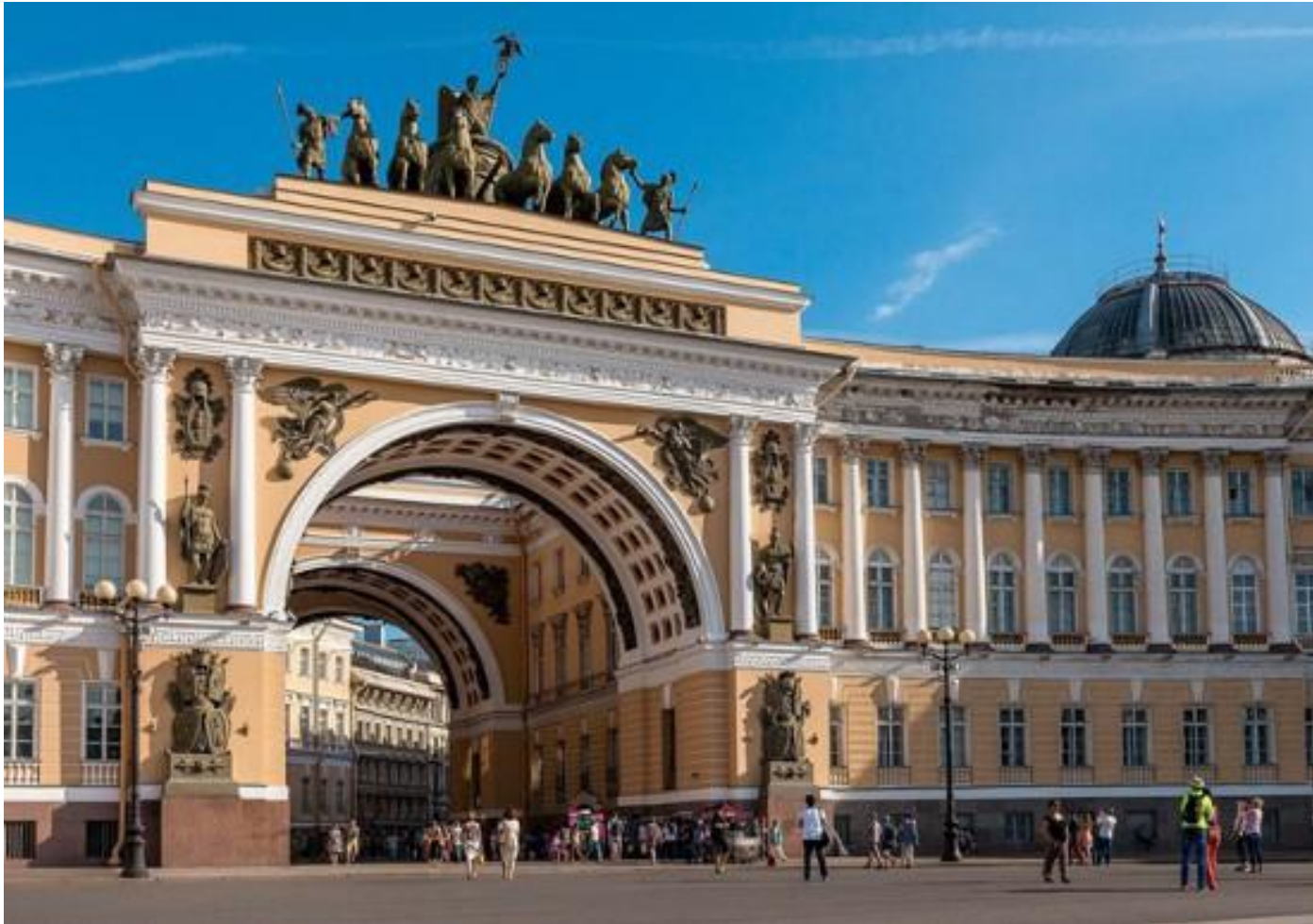
5. К.Росси. Здания министерства и арка Главного штаба на Дворцовой площади. Санкт-Петербург. 1819–1829.