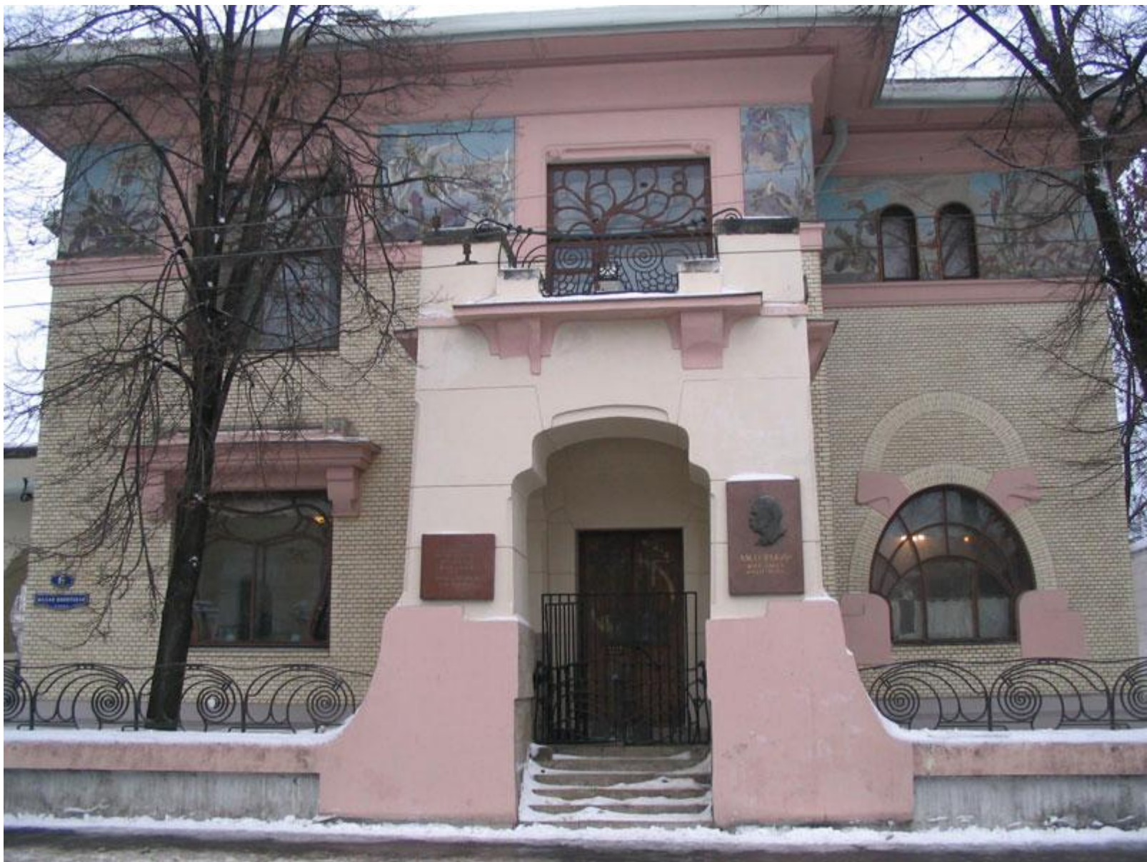
19. Ф.О.Шехтель. Особняк С.П.Рябушинского. 1898. Модерн.