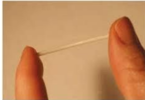
Figure 2: Visual of Implanon.