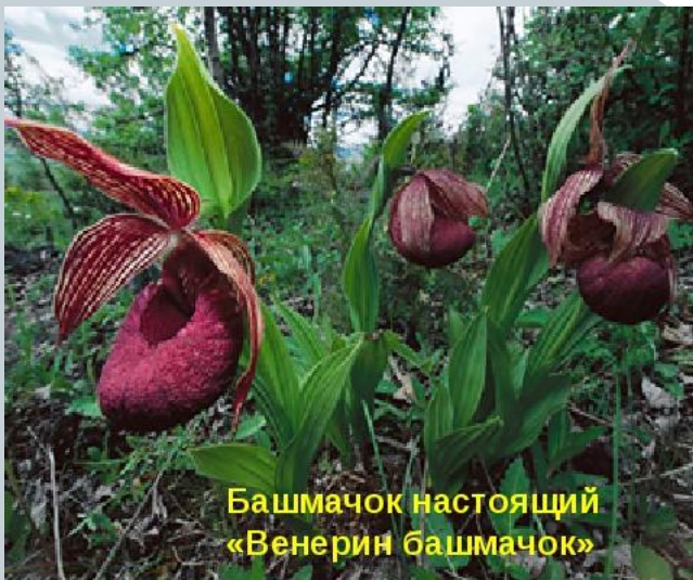
Башмачок настоящий «Венерин башмачок»