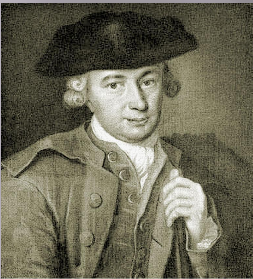
Иоганн Георг Гаман