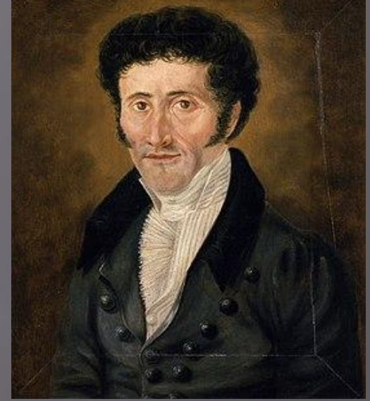
Эрнст Теодор Амадей Гофман