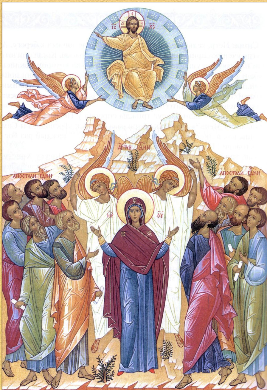
Вознесение Господа Иисуса Христа