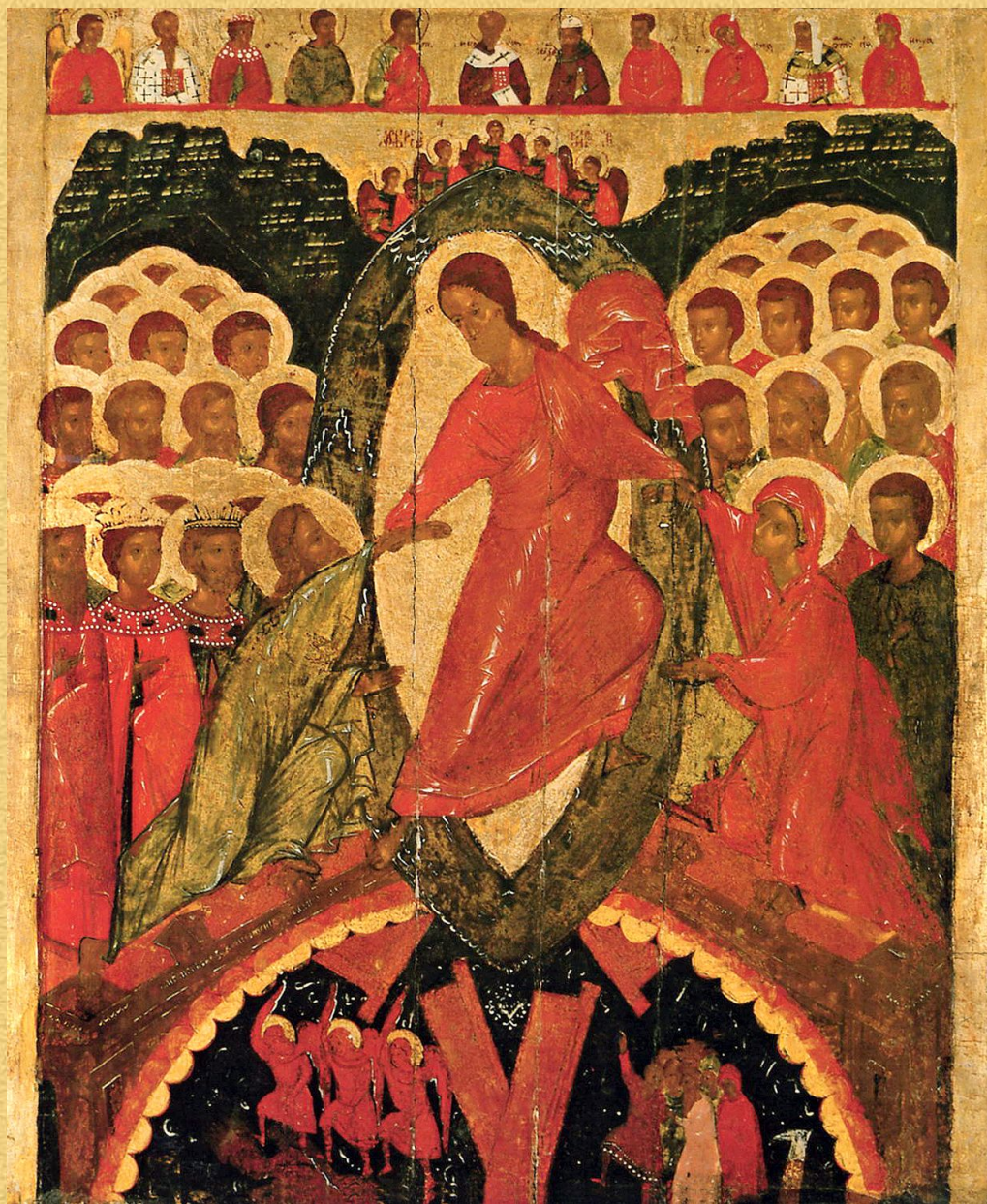
Сошествие Иисуса Христа во Ад