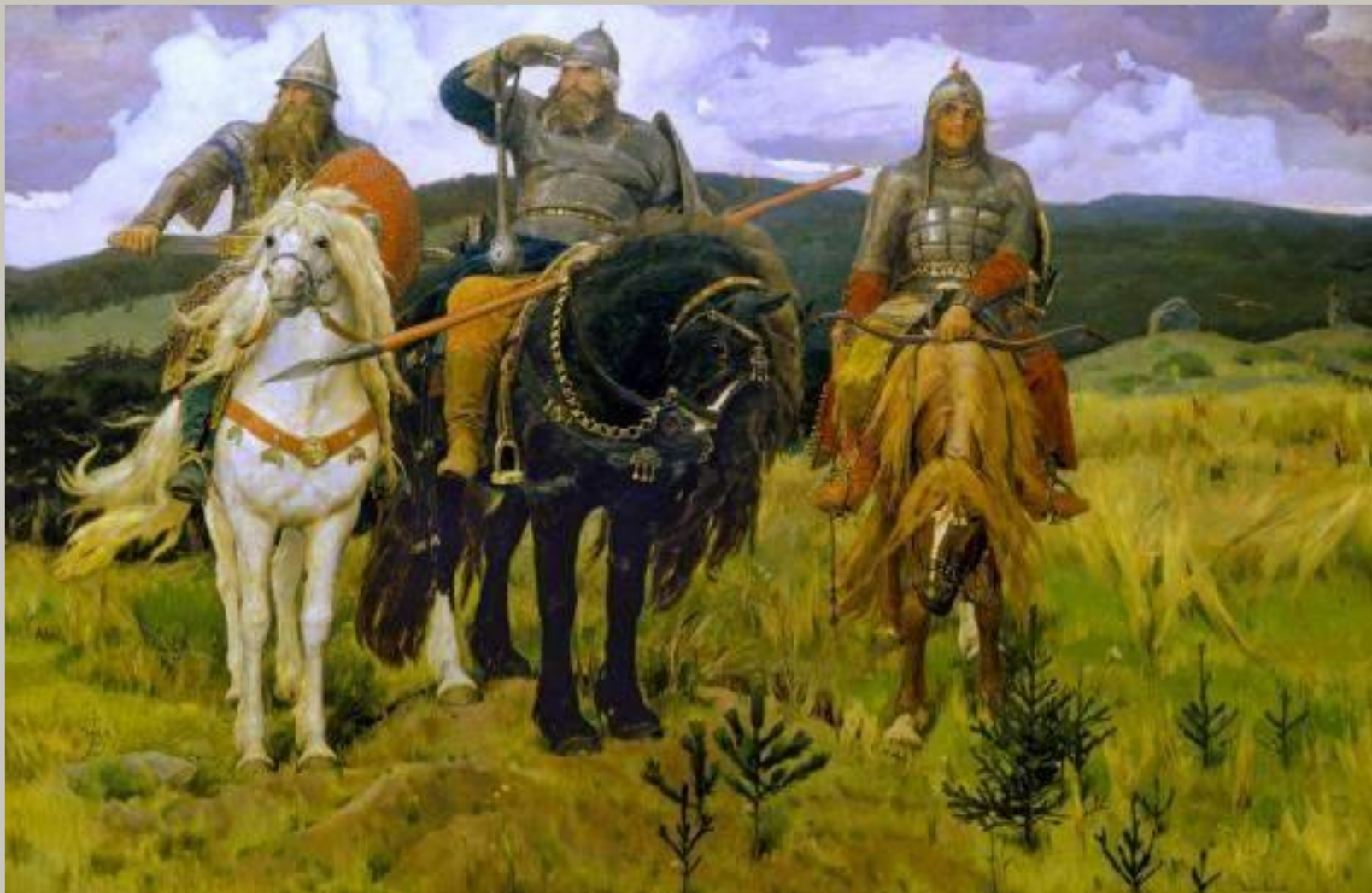
В. М. Васнецова "Три богатыря"