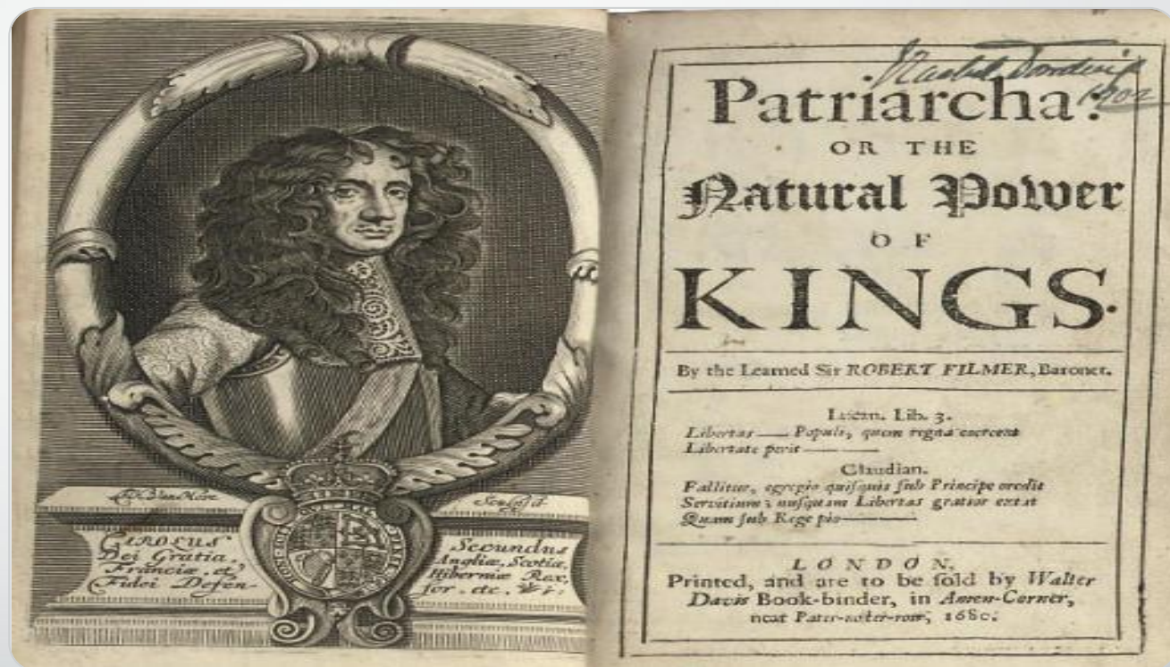
Роберт Филмер «Патриарх или естественная власть королей» Один из главных трудов по патриархальной теории.

Если углубиться в данную теорию происхождения государства, то можно понять, что она тесно связана с религией. Бог направляет на землю Адама, который становится главой первой семьи. С течением эволюции количество семей увеличивается. Итогом данной эволюции и является государство. Главы семей становятся правителями первых государств.