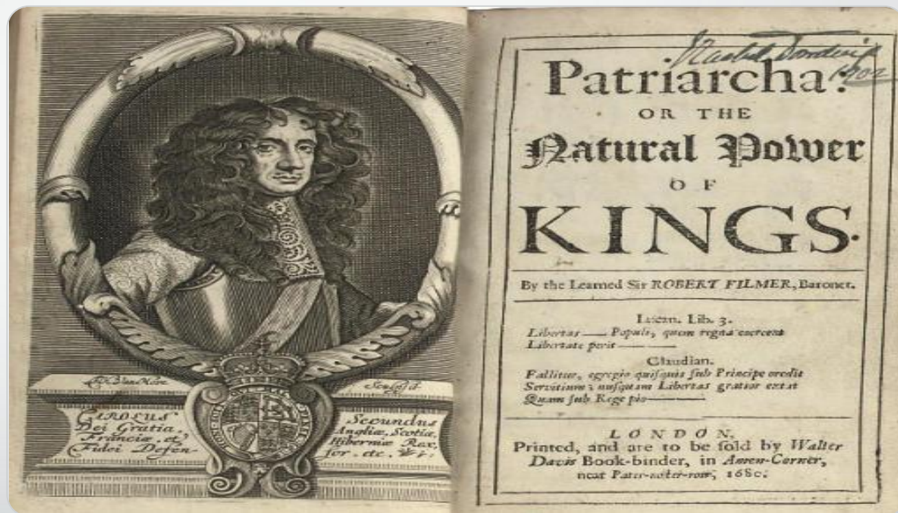
Роберт Филмер «Патриарх или естественная власть королей» Один из главных трудов по патриархальной теории.

Если углубиться в данную теорию происхождения государства, то можно понять, что она тесно связана с религией. Бог направляет на землю Адама, который становится главой первой семьи. С течением эволюции количество семей увеличивается. Итогом данной эволюции и является государство. Главы семей становятся правителями первых государств.