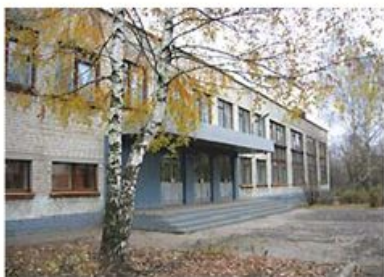
school.jpg — |