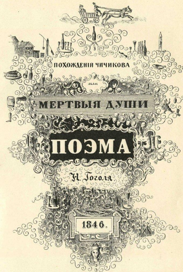
Обложка, рисованная самимъ Гоголемъ.

ОСНОВАТЕЛЕМ ЭТОГО НАПРАВЛЕНИЯ СТАЛ Н.В.ГОГОЛЬ