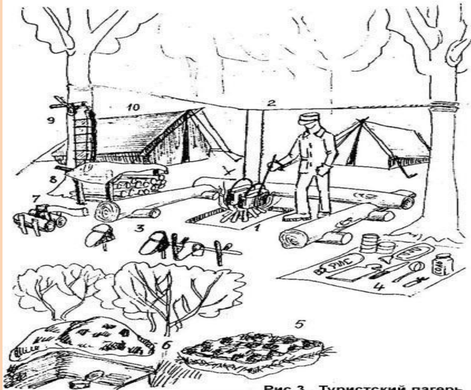
Рис.3. Туристский лагерь