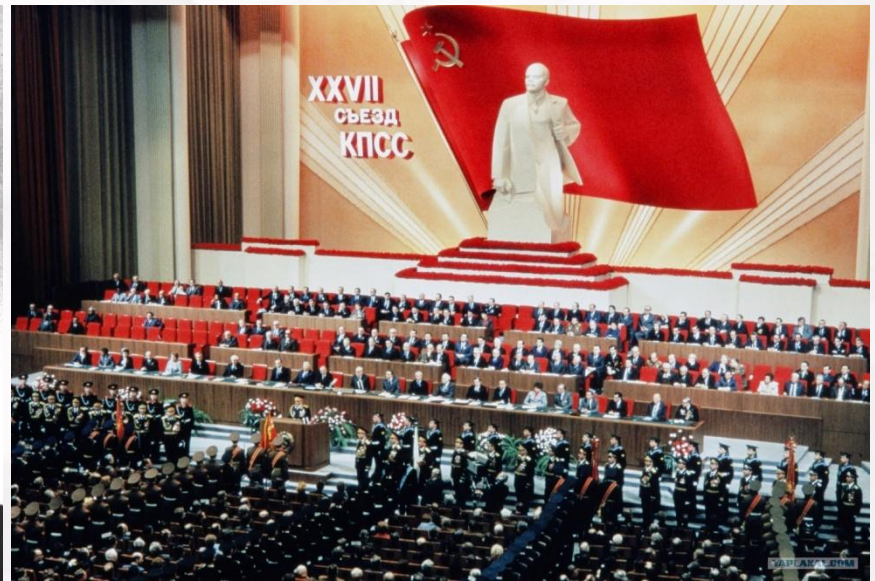
27-й съезд КПСС