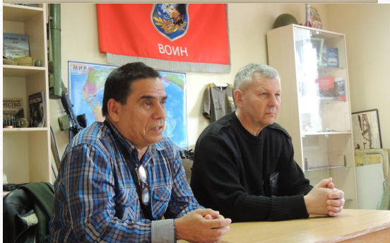
Встреча кубинского летчика с бойцами Клуба "Защитник".