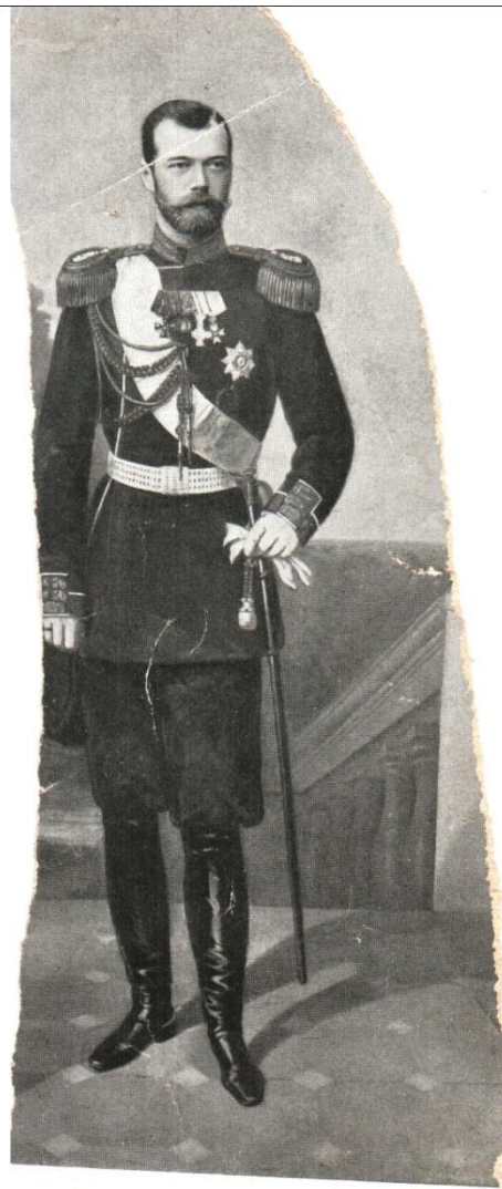
Его Величество Государь Император Александр Александрович. с и. Князя Александра Великого Модераторъ Статей Королевских. Свѣдѣн. Свѣдѣн.