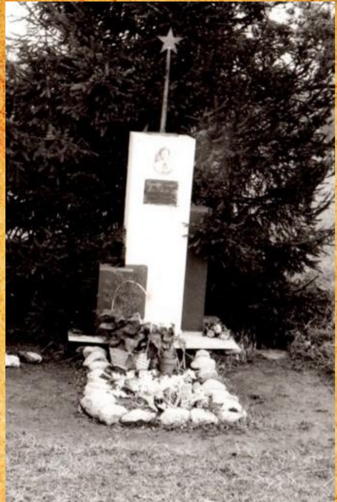
Могила Юты Бондаровской