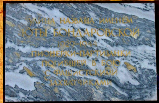
Мемориальная доска на улице Юты Бондаровской