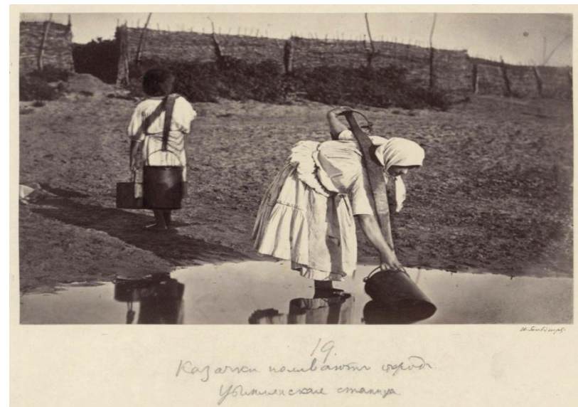
19. Казачки поилвакты сядди Удильмиская станца