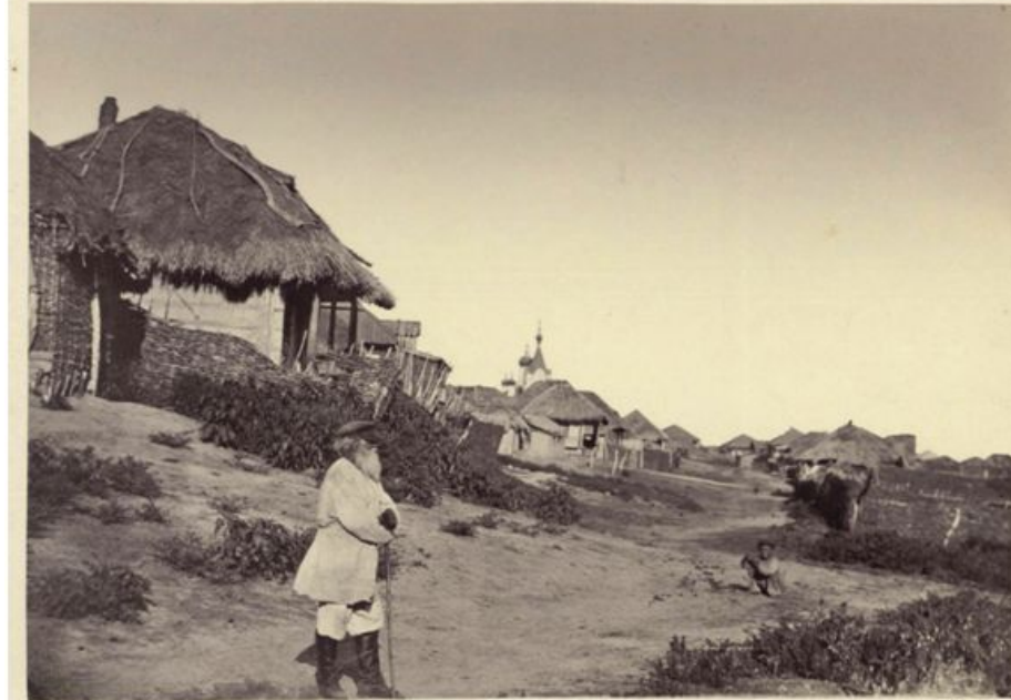
Улица в казачьей станице, 1875.