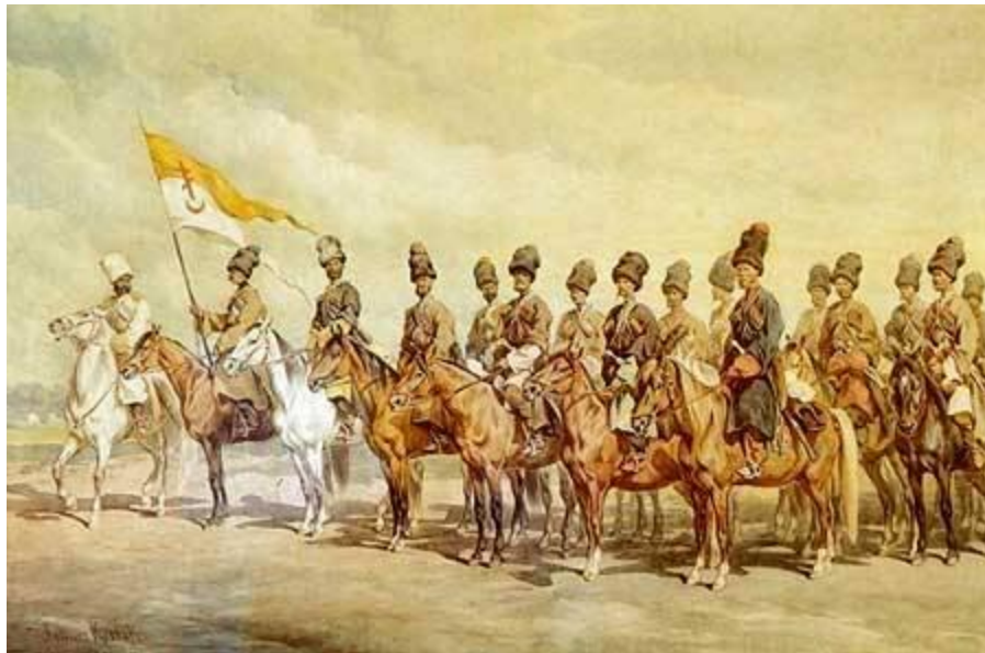
Донские казаки, середина 16 века

В 1571 г. появляется городок Раздоры , упоминается о существовании городка Митякина - на Донце .