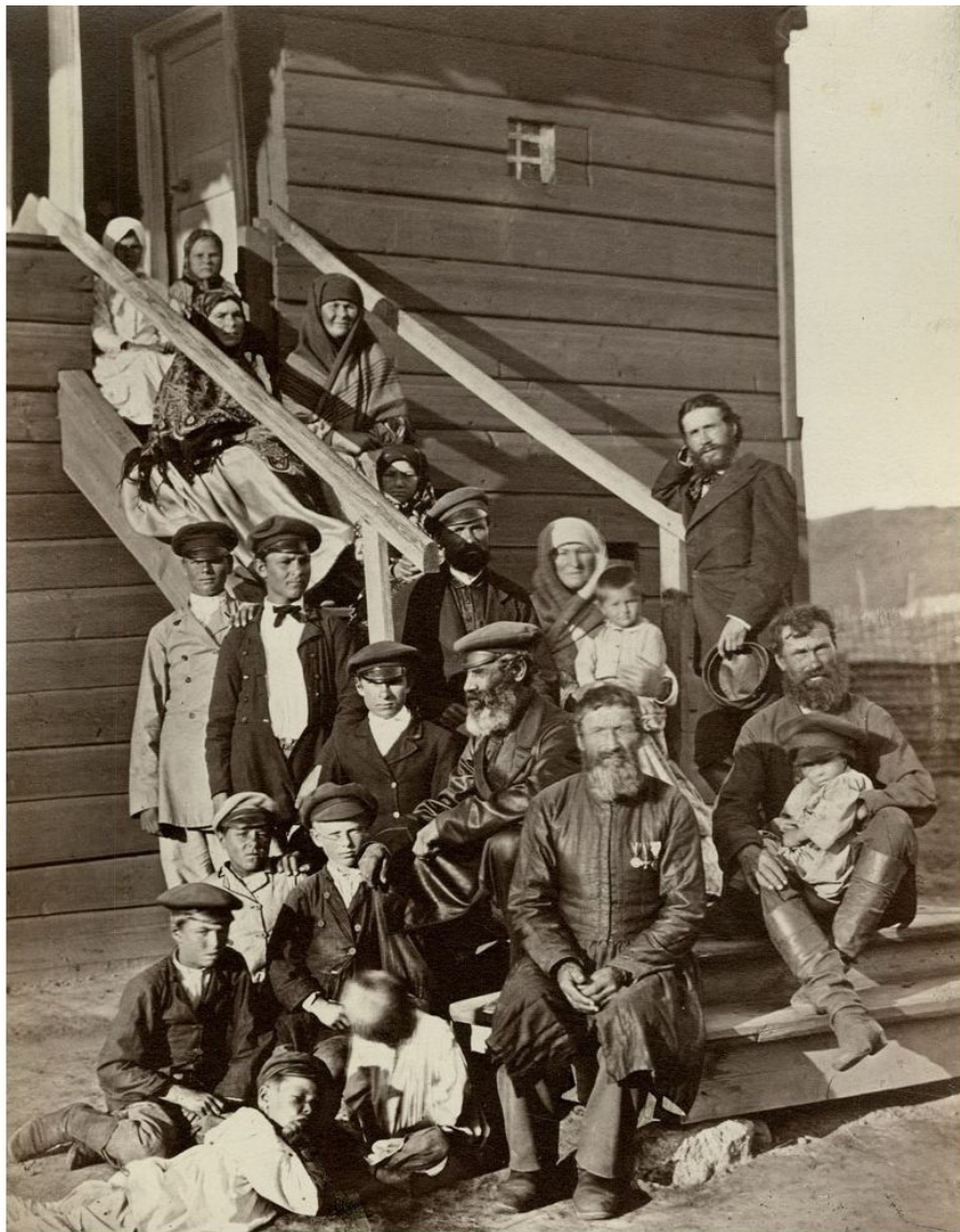
Семья донских казаков, 1875 год.