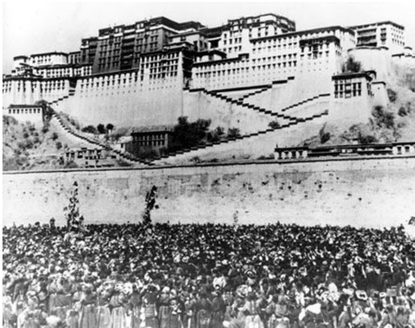
Восстание в Тибете 1959 г.

"С древнейших времен Тибет является неотъемлемой частью священной территории нашей родины", — премьер Госсовета Ли Кэцян