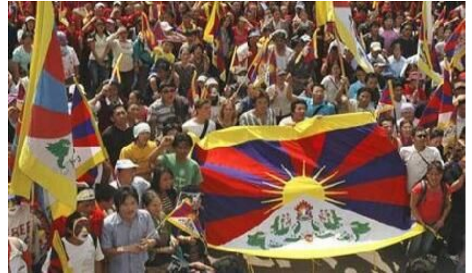
Восстание в Тибете 2008 г .