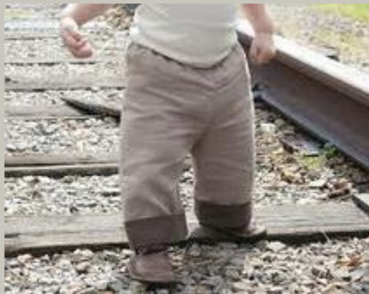
По железной дороге