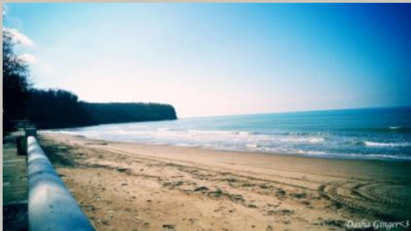
По берегу реки