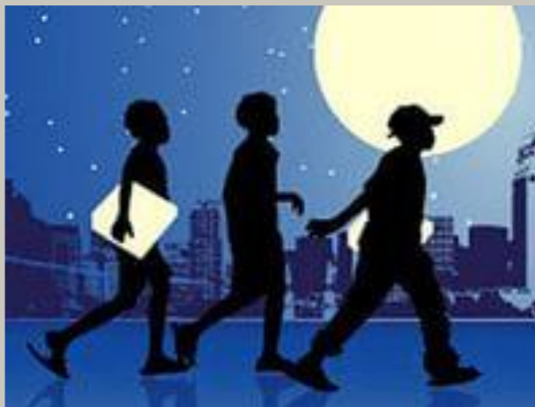
В чужих дворах