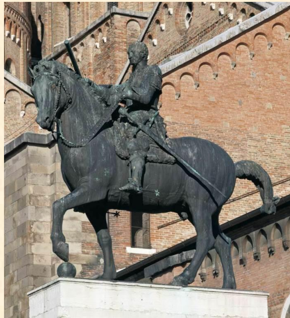
Донателло. Конный памятник кондотьеру Гаттамелате. Падуя