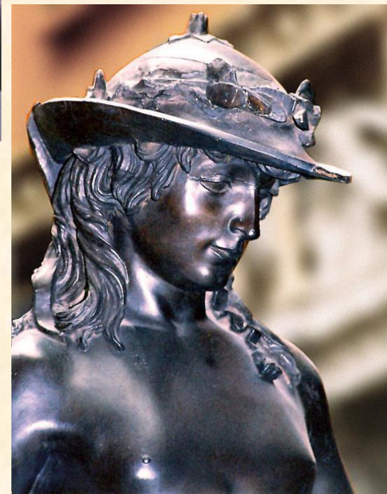
Бронзовая статуя Давида