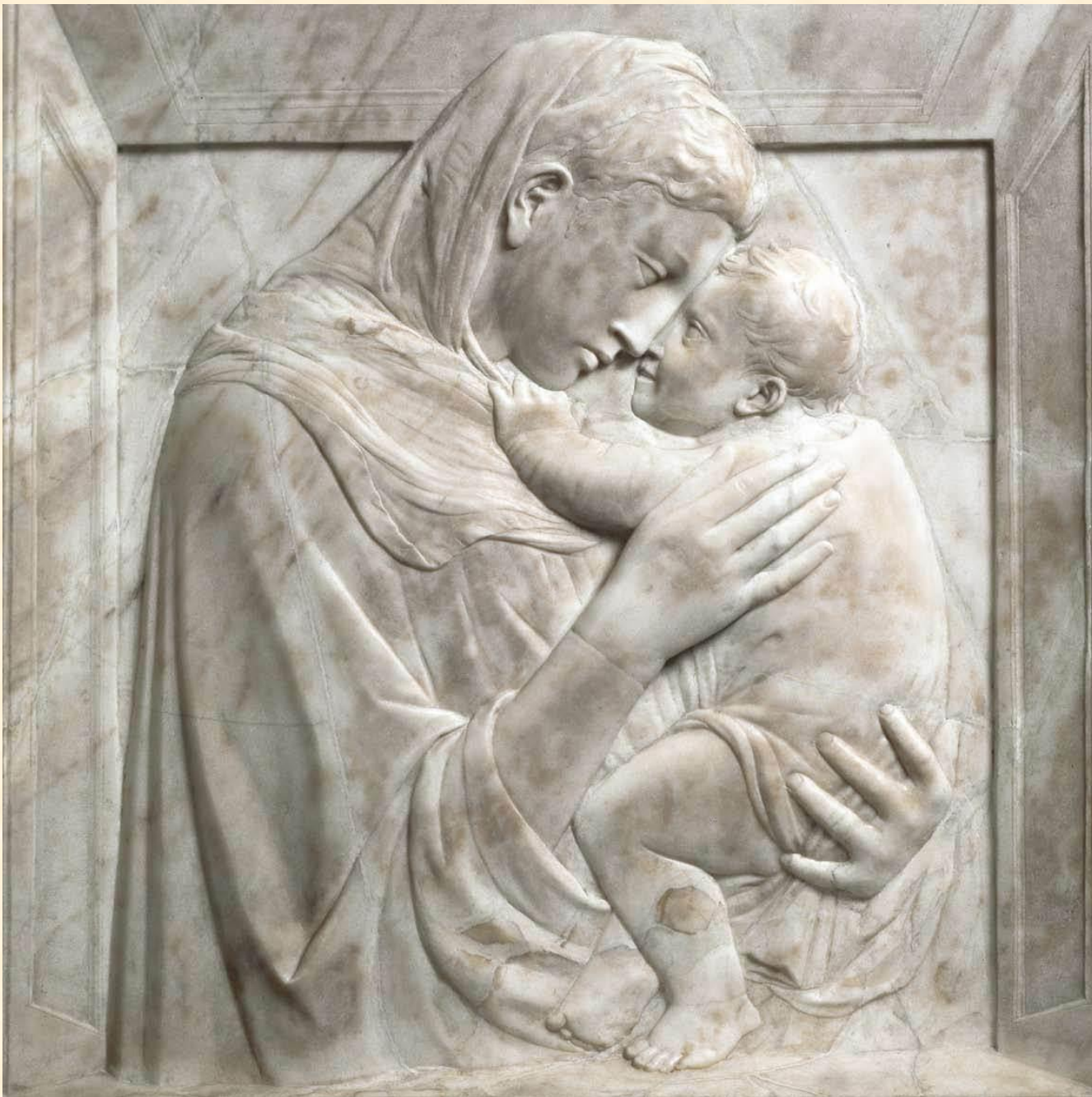
Донателло. Мадонна Пацци. 1422г.