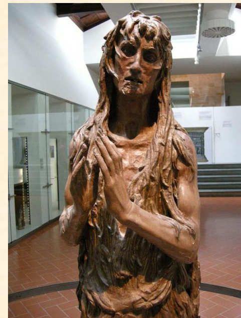
Донателло. Кающаяся Мария Магдалена