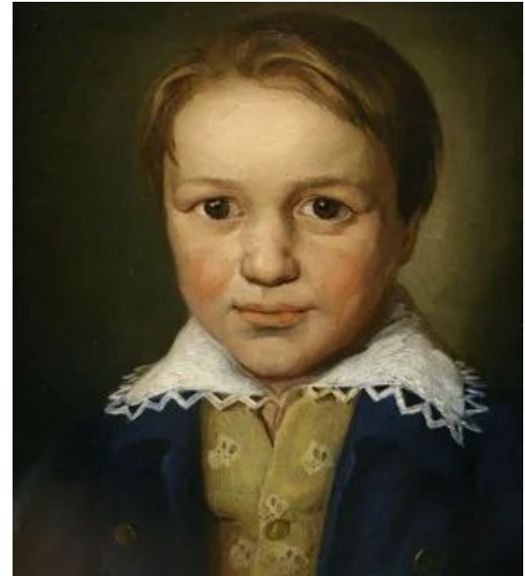
(Бетховен в 13 лет.)

Настоящим учителем Бетховена стал Кристиан Готлоб Нефе. Он познакомил Людвигу с творчеством Баха и Генделя. Благодаря Нефе, было издано и первое сочинение Бетховена — вариации на тему марша Дресслера . Бетховену в то время было двенадцать лет, и он уже работал помощником придворного органиста.