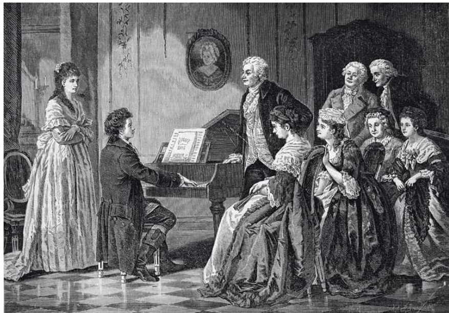
(Первое выступление бетховена.)

Первое публичное выступление Бетховена в Вене состоялось в марте 1795, где он дебютировал со своим фортепианным концертом .