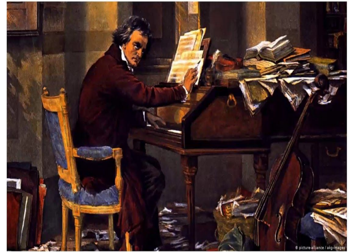
(Бетховен за работой дома.)

Из-за глухоты Бетховен редко выходит из дома, лишается звукового восприятия. Он становится угрюм, замкнут. Именно в эти годы композитор одно за другим создаёт свои самые известные произведения.