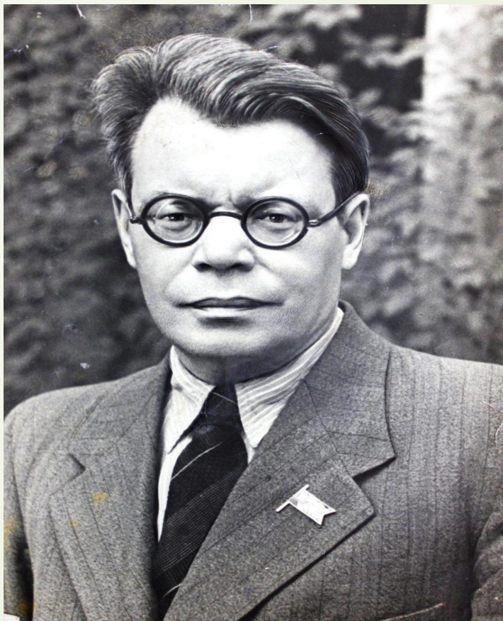
Михаил Васильевич Исаковский (1900—1973)