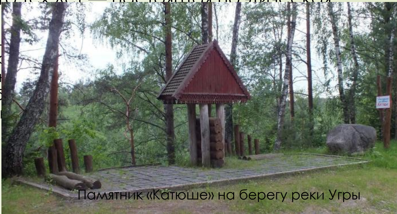
Памятник «Катюше» на берегу реки Угры

Памятник песне «Катюша». Катюша Исаковского, есть облагороженное место считается памятником песенной скамейка и угол деревенской изб. нём прикреплена табличка с нес