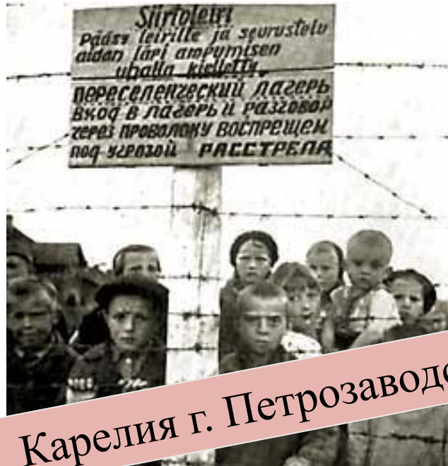
Карелия г. Петрозаводск