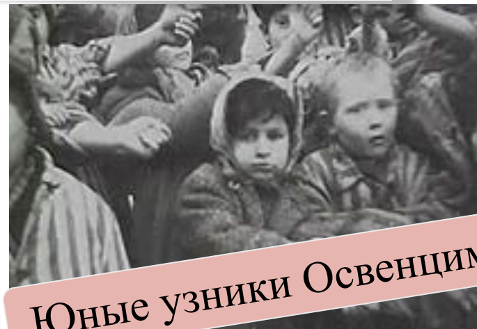
Юные узники Освенцима