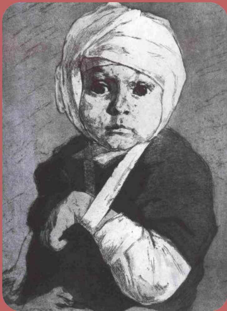
А. И. Харшак. «За что?» (Раненый ребенок). 1942