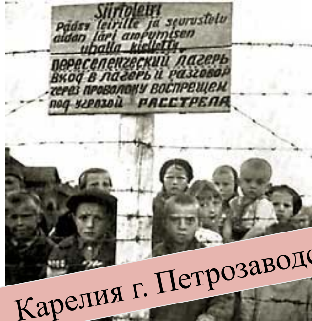
Карелия г. Петрозаводск