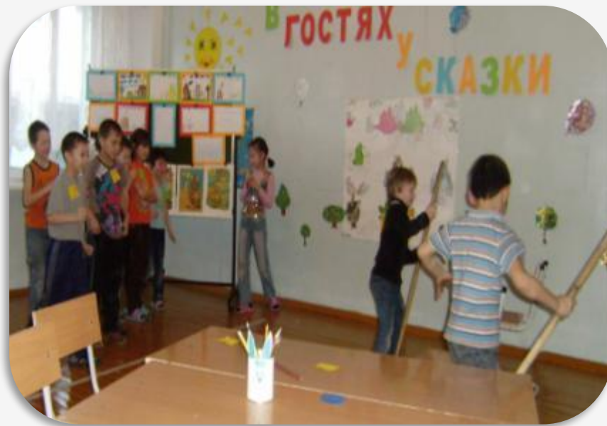
«Гонки» на швабрах