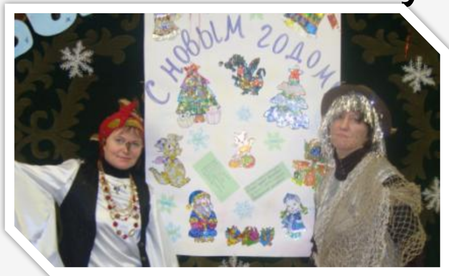
Конкурс новогодних газет