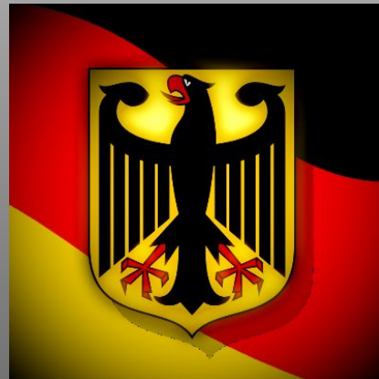
ТИМОХА-ХА (НИК НЕОПРЕДЕЛЁН)