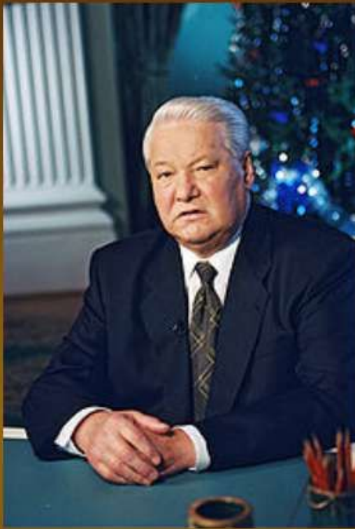
Борис Николаевич Ельцин

Избирался Президентом два раза (12 июня 1991 – 31 декабря 1999 г)