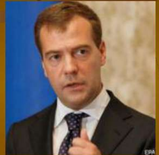
Медведев Дмитрий Анатольевич

Второй Президент Российской Федерации (2000 – 2008)