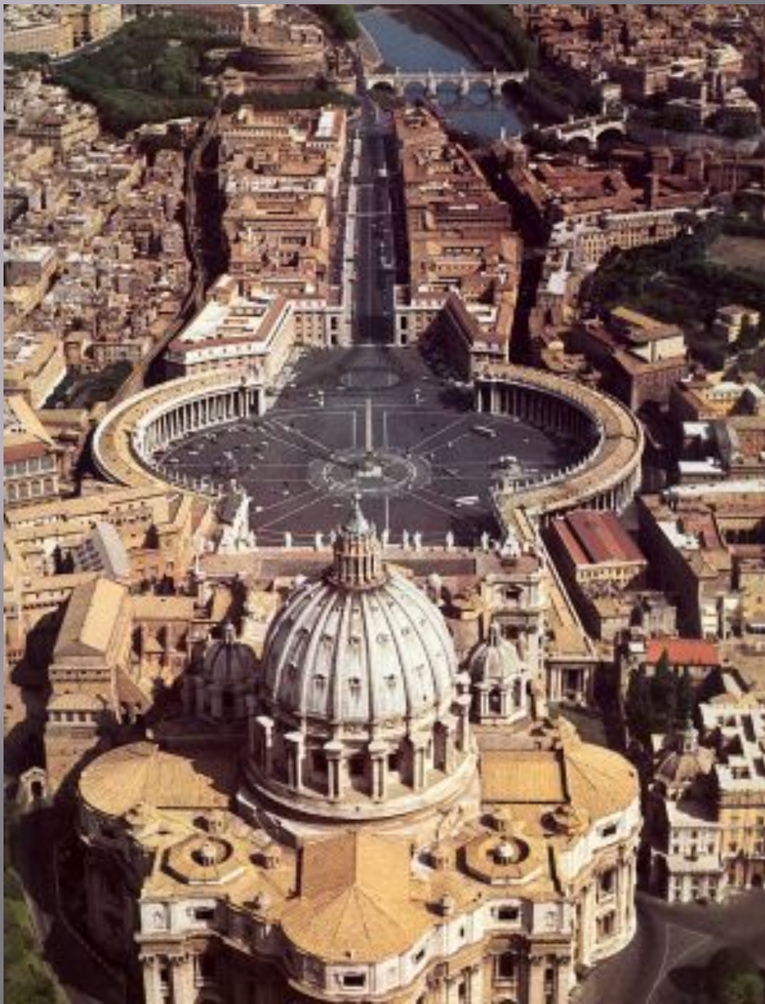
Собор св.Петра РИМ