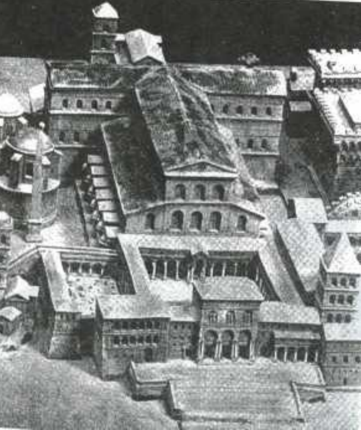
Реконструкция базилики св. Петра