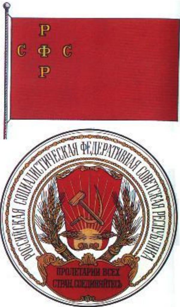
Флаг и герб РСФСР.

Гряд национальных окраин вошел в состав РСФСР на правах автономий. 1 ноября советская власть победила в Туркестане. В к.ноября в Коканде было провозглашено мест-ное национальное прави-тельство, но вскоре оно было ликвидировано красногвардейцами и Ту ркестан вошел в состав РСФСР. Недовольные этим начали басмачес-кое движение. Весной 18 г.в составе РСФСР были созданы Татаро-Башкир ская и Кубано-Черномор ская автономные респу-блики.