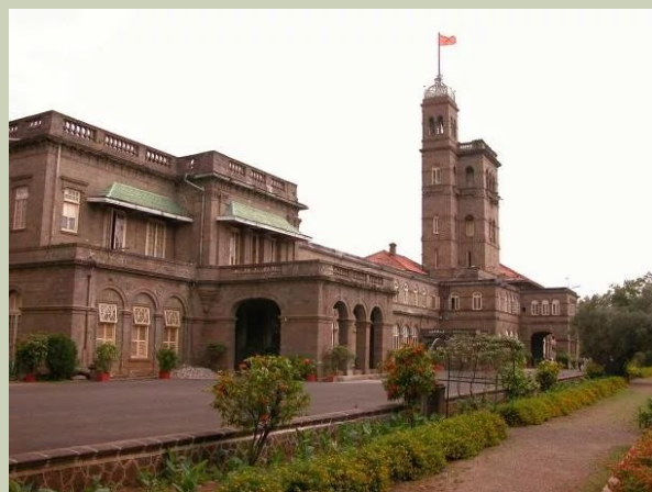
Indira-Gandhi National Open University