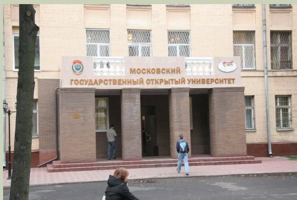
Московский Государственный Открытый Университет, Открытый Университет

1990-е годы используется определение «открытый» в названиях различных организаций в сфере образования: