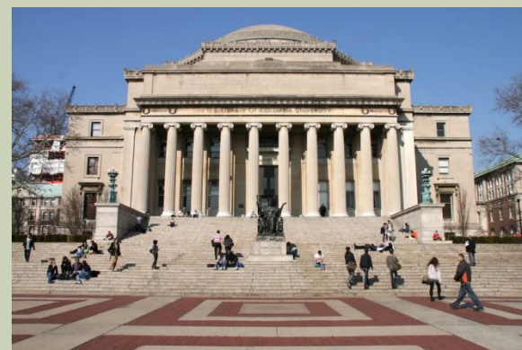
Государственный Открытый Университет Нью-Йорка (Нью- Йорк США)

Термин «открытое образование» также используется в названии одноименного журнала, который издается с 1997 г. и публикует материалы, в основном посвященные проблемам информатизации и дистанционного образования.