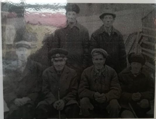
Односельчане - фронтовики