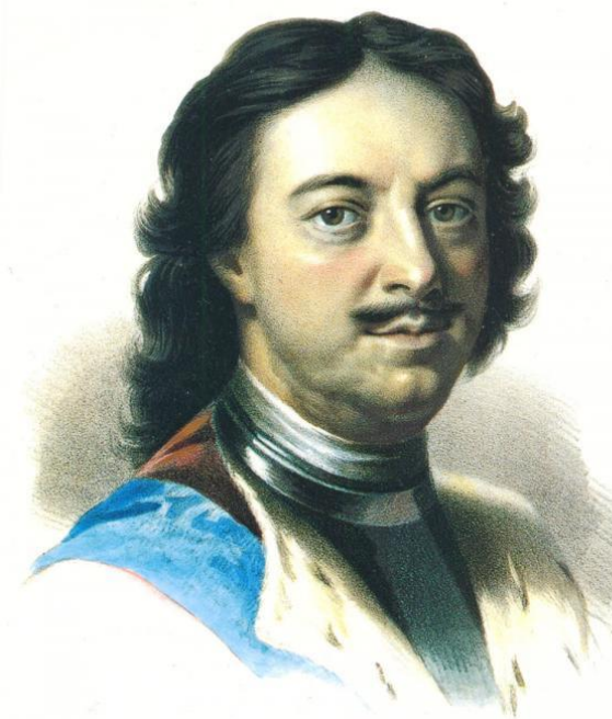
Peter the Great 1672 - 1725